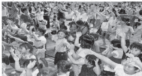
チャレンジデーのファイナルイベントでさいやま商店の曲に合わせて踊りに汗を流す参加者＝26日夜、市総合体育館メインアリーナ

自らの住民参加した運動を行った参加率を競うイベント「チャレンジデー2016」が、中山スポーツ財団主催で石垣市、与那国町と与那国町が対戦した。石垣市、与那国町は、それぞれ38・2％、35・1％の参加率となり、石垣市が勝利した。与那国町は、昨年に続き、参加率が低かった。