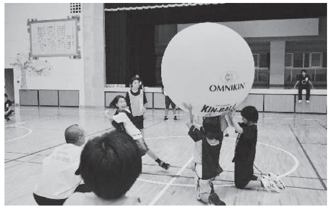
ゆたか小学校でキンボール

市民はゲーム感覚で楽しみながら参加できることで、スポーツを「しなければならない」ではなく、自ら進んで「したい」という気持ちで気軽にスポーツに取り組めたのではないかと考えております。今後本市においても、より一層の高齢化が見込まれる中、市民のスポーツへの意識向上は必須条件であります。そのような中で、楽しく参加できるチャレンジデーは、本市に最適な事業だと考えております。