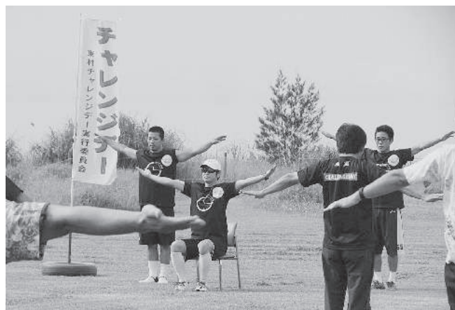
みんなでラジオ体操♪