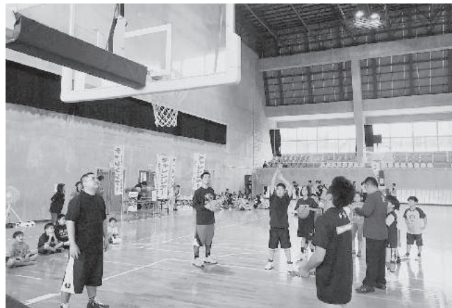
恒例のフリースロー大会

担当としては初めての取り組みでしたが、本村は 11 回目の実施ということもあり、村民の認識も高く、チャレンジデーが年間行事として定着していると感じました。結果は昨年を上回る参加率を記録し、対戦自治体にも勝利し喜ばしい面もありましたが、「運動したけど報告するのを忘れていた」という村民の声もあり、参加報告の意識を高めるための取り組みや、参加報告の方法も課題として感じました。そして、チャレンジデーをきっかけとして東村はもちろん、沖縄県が健康長寿 No1 を目指すイベントとして期待しています。