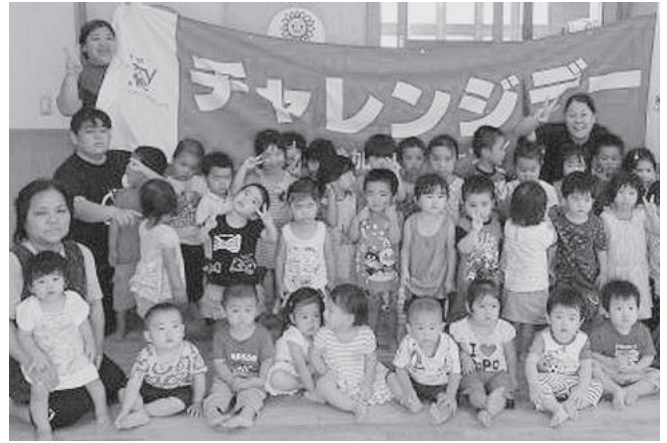
集合写真 子ども達

初の試みで、内容や当日の報告方法など、住民に伝わっているのか心配な点もありましたが、多数の参加があり良かったです。次回の参加では頑張りたい等、前向きな声も聞けたり、健康づくりへの関心が高まったように思います。