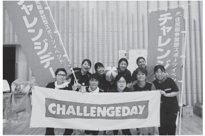
ソフトバレーボール

またチャレンジデー開催に向けての各種団体の取組が図られ、連携強化に繋がっていると感じます。