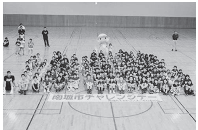
バスケット交流会