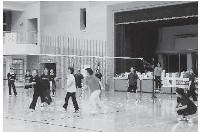
ソフトバレーボール