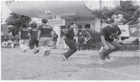
大橋跳びにチャレンジする参加者＝25日午前、町役場前庭

初勝利を逃した与那国町長は「初めての参加者の参加率が低かったのは残念だが、来年はもっと参加率を上げていきたい」と話した。