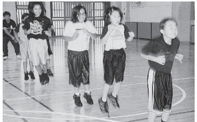
ロープ・ジャンプ・X