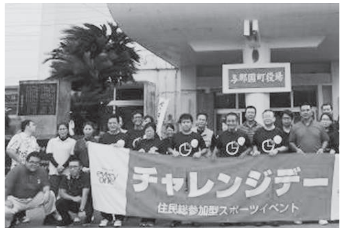
集合写真 役場前にて