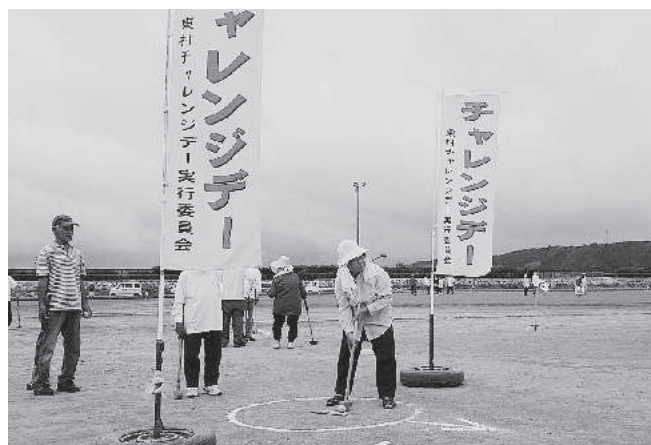
老人会グラウンド・ゴルフ大会