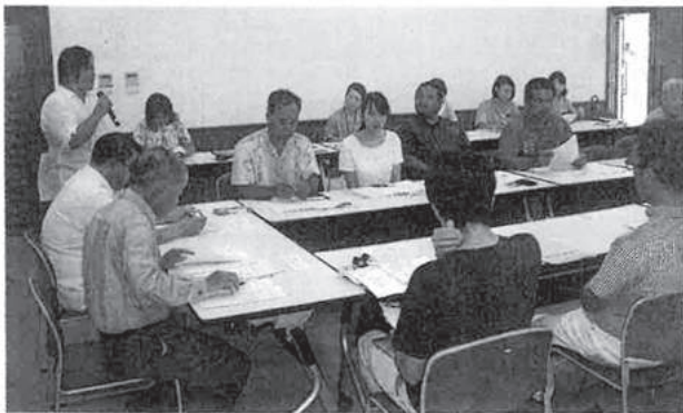
2016年5月14日 土曜日 八重山毎日新聞

【与那国】2018年度から実施予定の「与那国町食育推進計画」の第1回策定委員会と、同町で今年度第2次を迎えた健康増進計画「どうなん健康づくの21」の推進会議が10日、町構造改善センターで開かれ、町内の各団体の代表と長寿福祉課の職員らが、今年度の取り組みを確認した。写真。