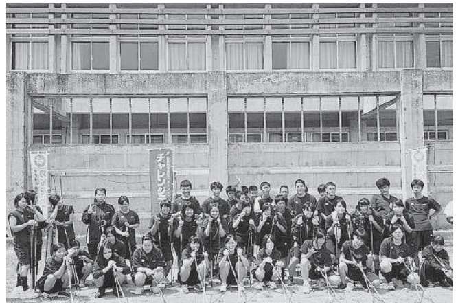
ノルディックウォーキング会場で集合写真