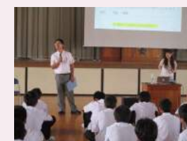
岩手県立黒沢尻工業高等学校