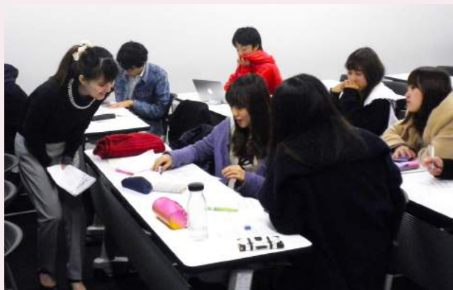
早稲田大学での授業の様子

通常のゲートキーパー研修とは異なり、私たちのモデルでは座学での学習だけでなく、その後の実践や振り返りを重視していることが特徴です。意識的に日常生活を送ることで、身近な友人や家族の異変にいち早く気付いたり、辛い気持ちを受け止めたりすることにつながります。知識だけでなく、実践と振り返りを伴うことが「心の支え手」の育成で最も重要なことだと考えています。