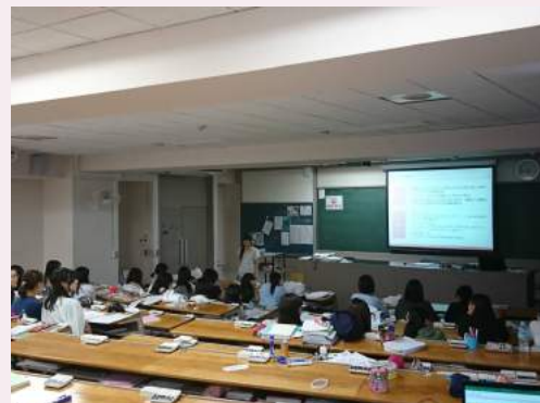
東京女子医科大学での授業の様子

「日常での実践」と「振り返り」を重ねることが「支え手」育成のポイントです。各市区町村別の自殺実態分析や地域実情に基づき、セルフケアや身近な支え手育成研修も1日単位で行わせていただいています。