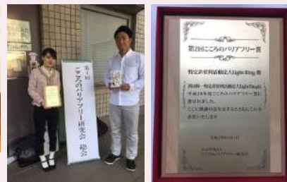
こころのバリアフリー賞