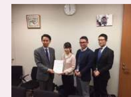
自殺総合対策大綱に関する要望書を提出