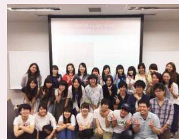
東京成徳大学での講演の様子

自殺やうつのリスクがある若者は全国にいます。私たちは各市区町村別の自殺実態分析や地域の実情に基づき、セルフケアや身近な支え手育成研修も1日単位で行わせていただいています。2017年度は18回、2011名に研修・講演をさせていただきました。