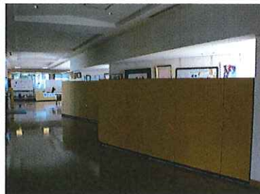
No11 No12 No13 No14 No15 No16