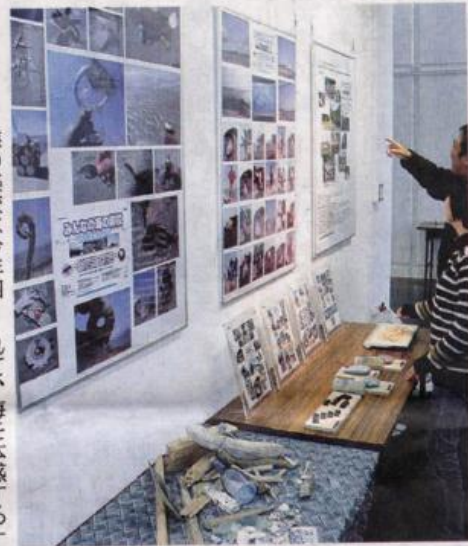
三河湾を舞台にした「みんなの海の楽校」の活動を報告する展示―岡崎市美術館で