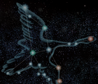
はくちょう座 翼を代表する星座のひとつ。 天の川の上に十字の姿に翼を広げ、 くちばしの星は望遠鏡で2つに見える