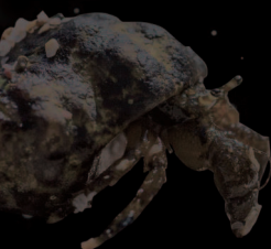
ヤドカリ 巻目の目殻に体を収め、 目殻を背負って生活する甲殻類