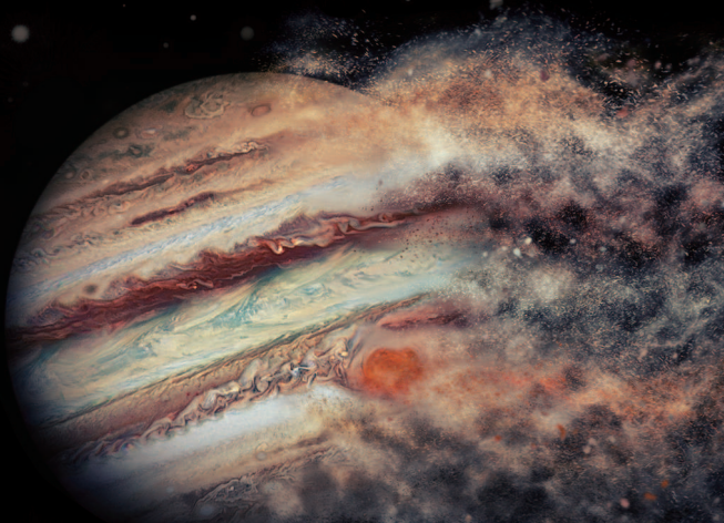
木星 地球の約11倍、太陽系最大の惑星 4つのガリレオ衛星を従えている。 縞模様と大赤斑がみどころ