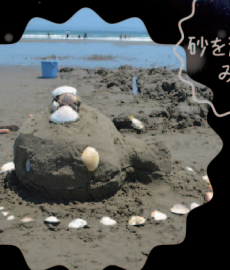
砂を溶かしてみよう