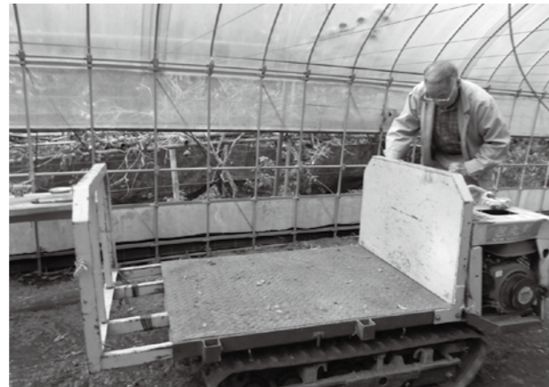
フォワーダ（木を運ぶ機械）

降ると椎茸が水分を吸って開いちゃったりする。水分を含んだ状態で収穫し、乾燥すれば薄っぺらな木の葉のようなものになってしまう。だから天気が2～3日続いている時に収穫して乾燥するってのが干し椎茸のコツ。