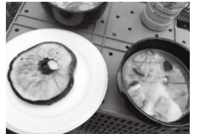
幸せなお昼ごはん