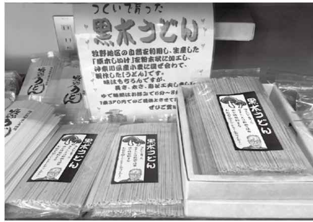
店頭並ぶ黒木うどん

神力がそろわないとなかなかできる仕事じゃない。でも、高校卒業したら「ちょっとお父さん、椎茸やってみないんだけど」って言うのよ。「何事にも音を上げず辛抱強く徹底した考えで努力していく気持ちがあるならいいよ」って言って始めたの。