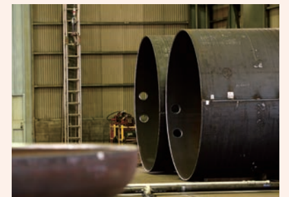
陸上用の機器・部品も製作