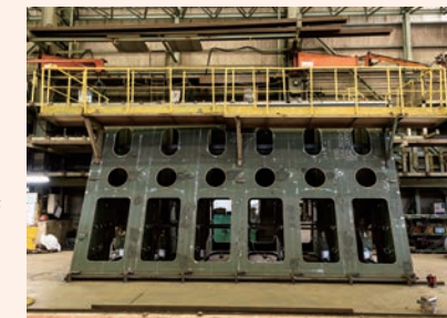
ディーゼルエンジン用架構

自動車と比べてもケタ外れに大きく、頑丈な船のエンジン。そんな船を動かすパワーの源を、下から支える「架構」と呼ばれる装置をつくるのが主な仕事です。船以外では、発電所などで使う様々な装置、部品を製造しており、溶接や機械加工などいろんな技術を磨けるのも魅力。大手重工業メーカー・IHIグループの一員として、世界を舞台にビッグな取引に関われます。