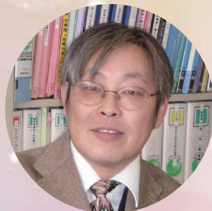
鈴木 典夫氏 (福島大学行政政策学類 教授)