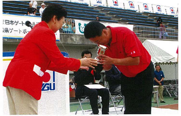
▲優勝杯返還：前年度優勝 健祥会キング（徳島県）