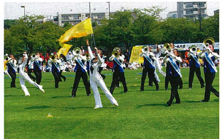
▲アトラクション：名古屋女子大学中学校高等学校 吹奏楽マーチングバンド部