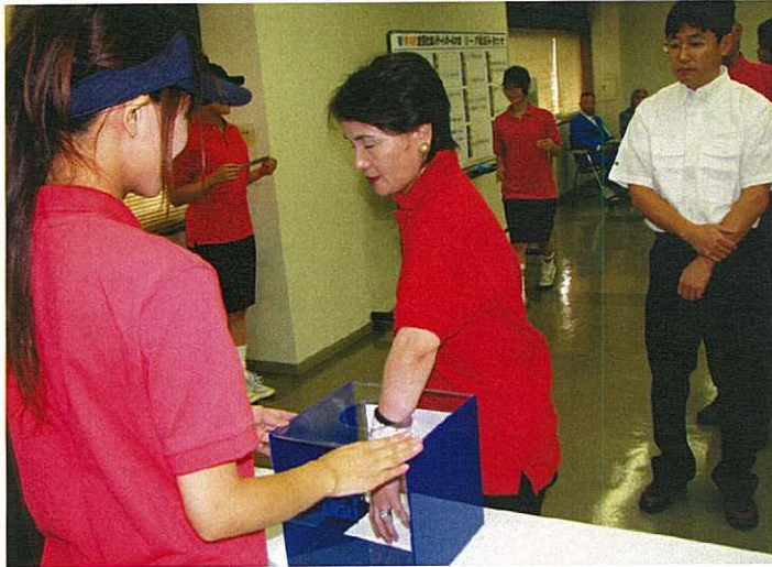
▲リーグ戦組み合わせ抽選会