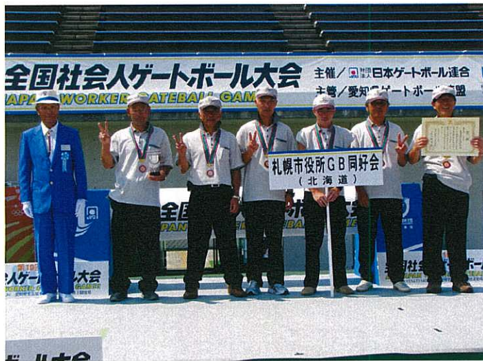
▲第3位：札幌市役所GB同好会（北海道）