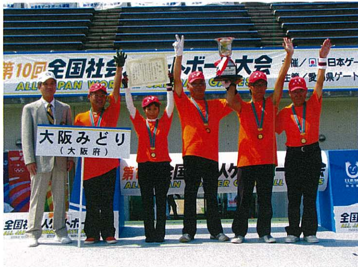
▲優勝：大阪みどり（大阪府）