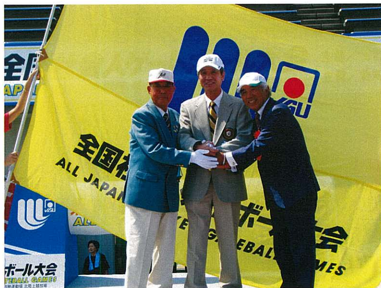
▲旗の引き継ぎ：次回栃木県へ