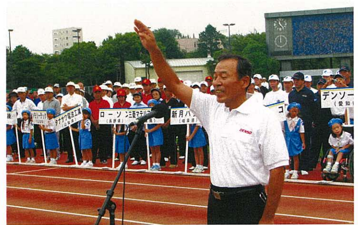
▲選手宣誓：愛知県代表 デンソー西尾