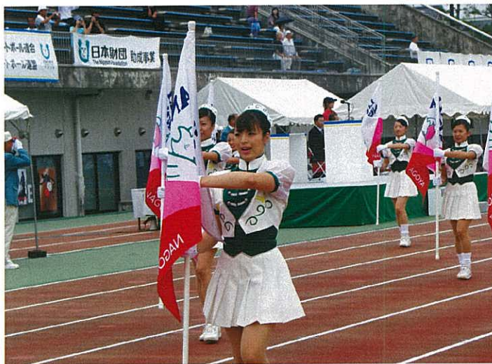
▲式典協力：名古屋市消防音楽隊 カラーガード隊「リリーエンゼル」