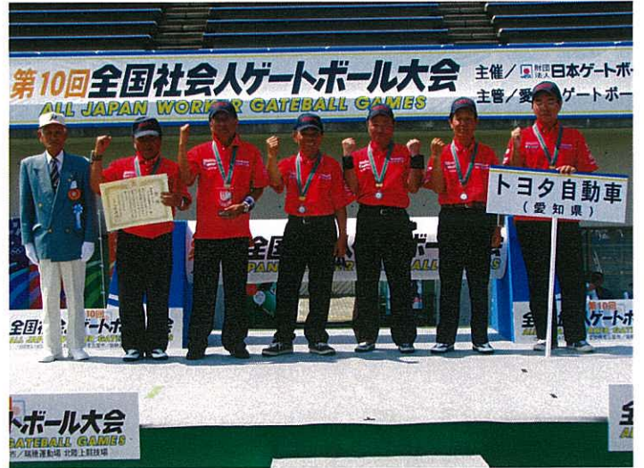
▲準優勝：トヨタ自動車（愛知県）