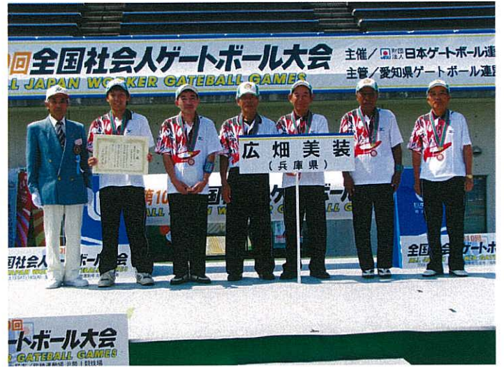
▲第3位：広畑美装（兵庫県）