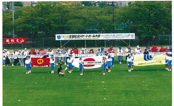
▲式典協力：社団法人ガールスカウト日本連盟 愛知県支部