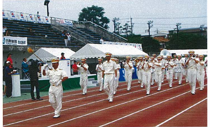
▲式典協力：名古屋市消防音楽隊