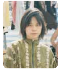
やないはらみくに 矢内原美邦 (演出家・振付家)

ニブロール主宰。日常的な身振りをベースに現代をドライに提示する独自の振付で国内世界各地のフェスティバルなどにも招聘される。劇作・演出も手がけ2012年岸田國土戯曲賞を受賞。off-Nibroll名義で美術作品の制作も行い、上海ビエンナーレ、大原美術館、森美術館などの展覧会に参加。ダンスと演劇、美術などの領域を行き交いながら作品制作を行う。2001年ランコントレ・コレオグラフィック・アンテルナショナル・ドゥ・セーヌ・サン・ドニ・ナショナル賞、2007年に第1回日本ダンスフォーラム大賞受賞、2012年に横浜市文化芸術奨励賞を受賞。近畿大学文芸学部芸術学科舞台芸術専攻准教授。