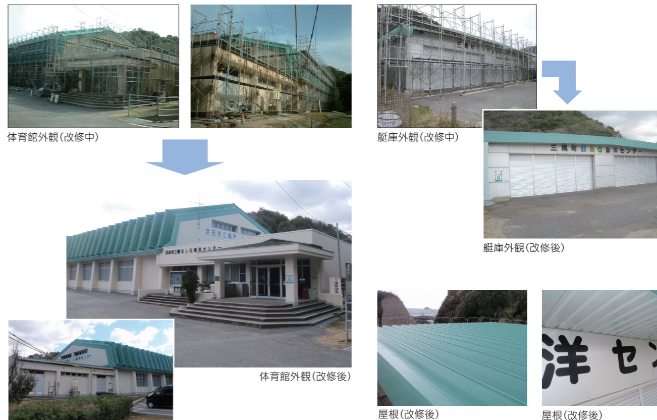
体育館外観(改修中)