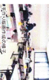
手作り版画作成の様子