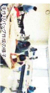
手作りバザー作成の様子