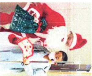
サンタさんにお手紙を書いてくれたお子様

2019年12月21日出福島県立医科大学附属病院に入院している子どもたちへ、パンダハウスのサンタさんからクリスマスプレゼントを届けました。突然のサンタクロース登場にビックリの子どもたち、サンタさんへ手紙を書いて待つてくれた男の子。6月から心を込めてプレゼント作りにご協力いただきましたボランティアの皆様にご感謝いたします。