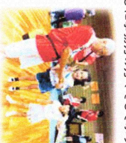
リレーフォーライフ・ジャパン2019福島

ボランティア仲間の皆様のご助言をいただきながらボランティア活動を行ってききましたが、今後さらに継続していきたいと考えております。どうぞよろしくお祈りいたします。