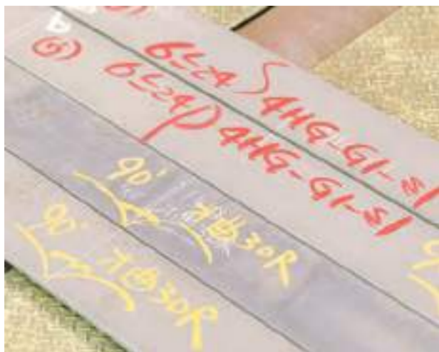
土山さんが記したラインや目印に沿って、その後加工していく。