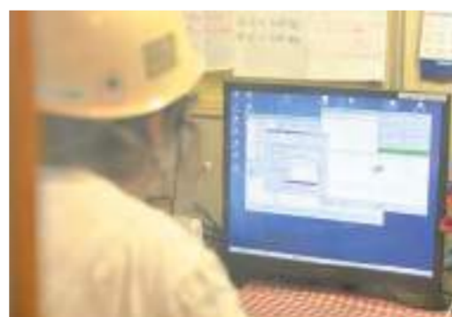
やりたいことに 挑戦するのが一番！