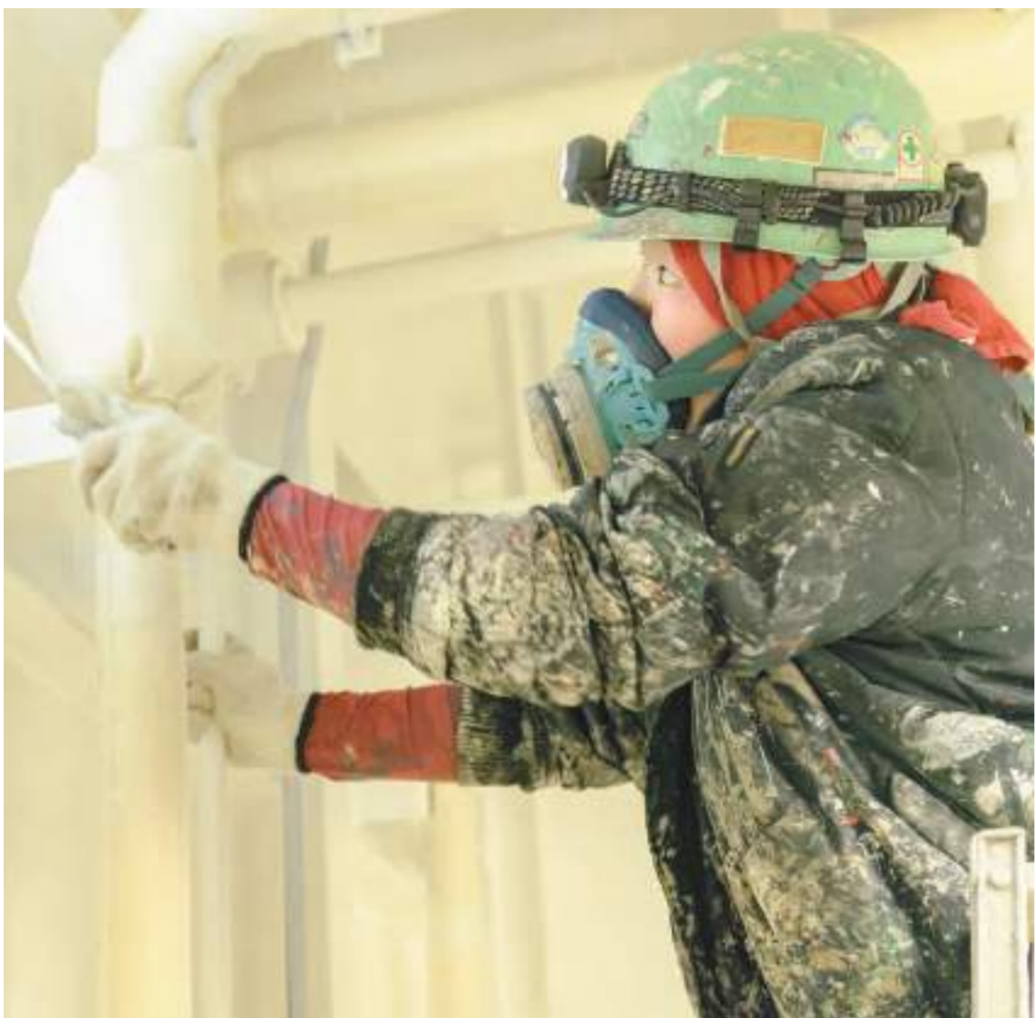
ローラーや刷毛(はけ)を使って、船内を隅々まできれいに塗装する。

子に手を焼くこともあるのですが、「うちの子はこうだったよ」と、いつも親身に相談に乗ってくれるんだそう。息子の学校行事や急な体調不良のときも、家族のことを最優先で考えてくれるアットホームな職場です。それでも、まだ20代。ヘルメットの中はカラフルなヘアで着飾り、ネイルにも派手な装飾が。「こういうの、好きなんです」。船の上でも、ファッションやオシヤレを楽しむ女性が多くいます。