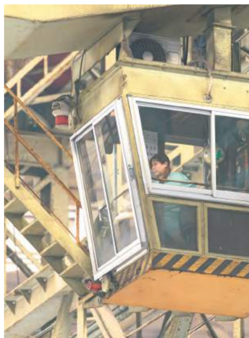
「男性が多いため逆に気をつかうことなく、楽しく働いています。」