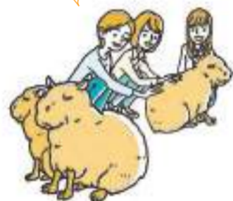
長崎バイオパーク