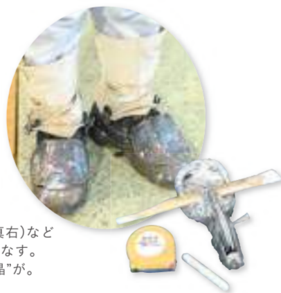
チョークライン(写真右)など 特殊な道具を使いこなす。 足元には「努力の結晶」が。