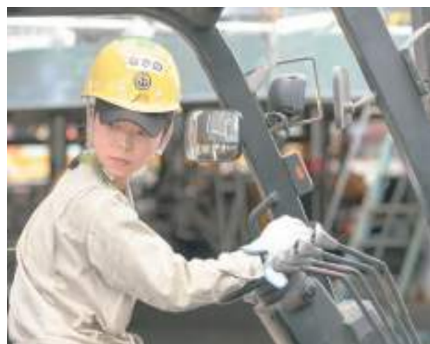
フォークリフトは入社後に資格を取得！今では軽やかに乗りこなす。