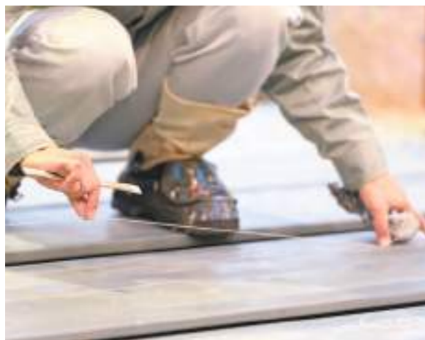
わずかな誤差も許されない。そんな緊張感も、やりがいにつながっている。