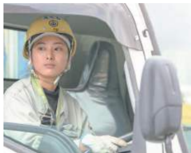
大きなトラックの運転もお手の物！狭い道を縦横無尽に走り回る。