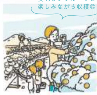
いちご・みかん狩り