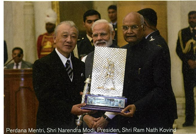
Perdana Menteri, Shri Narendra Modi, Presiden, Shri Ram Nath Kovind