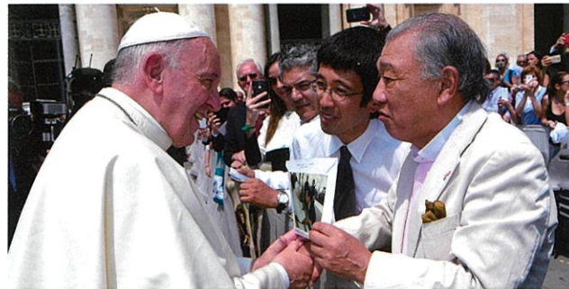
Bersama Paus Fransiskus Vatikan (Jun. 2016)