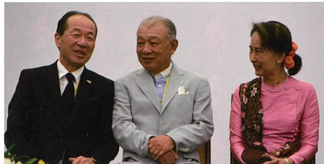
Bersama Daw Aung San Suu Kyi (Penasihat Negara Myanmar) dan Mr. Ichiro Maruyama (Duta Besar Jepang) (Nay Pyi Taw, Myanmar, Dec. 2018)

Penyakit kusta dan diskriminasi penderita kusta ibarat seperti dua roda pada sepeda motor.