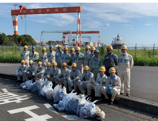
秋の海ごみゼロウィーク 参加風景