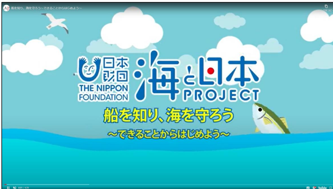
海の大切さや海ゴミ対策の重要性を知ってもらうための動画