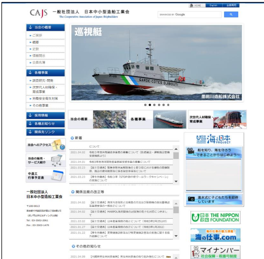
一般社団法人日本中小型造船工業会のホームページ（トップ画面）