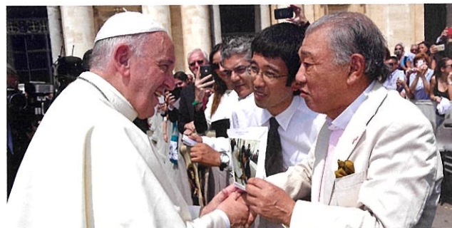
Com o Papa Francisco. Vaticano (jun. 2016)