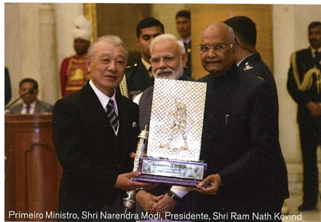
Primeiro Ministro, Shri Narendra Modi, Presidente, Shri Ram Nath Kovind