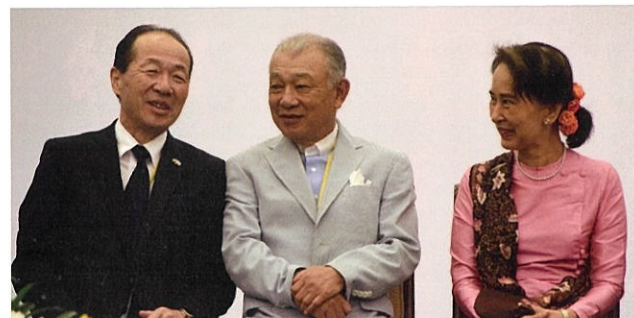
Daw Aung San Suu Kyi, Conselheira de Estado de Mianmar, Sr. Ichiro Maruyama, Embaixador do Japão (Nay Pyi Taw, Mianmar, dez. 2018)

A doença e a discriminação causadas por ela são as duas rodas de uma moto.