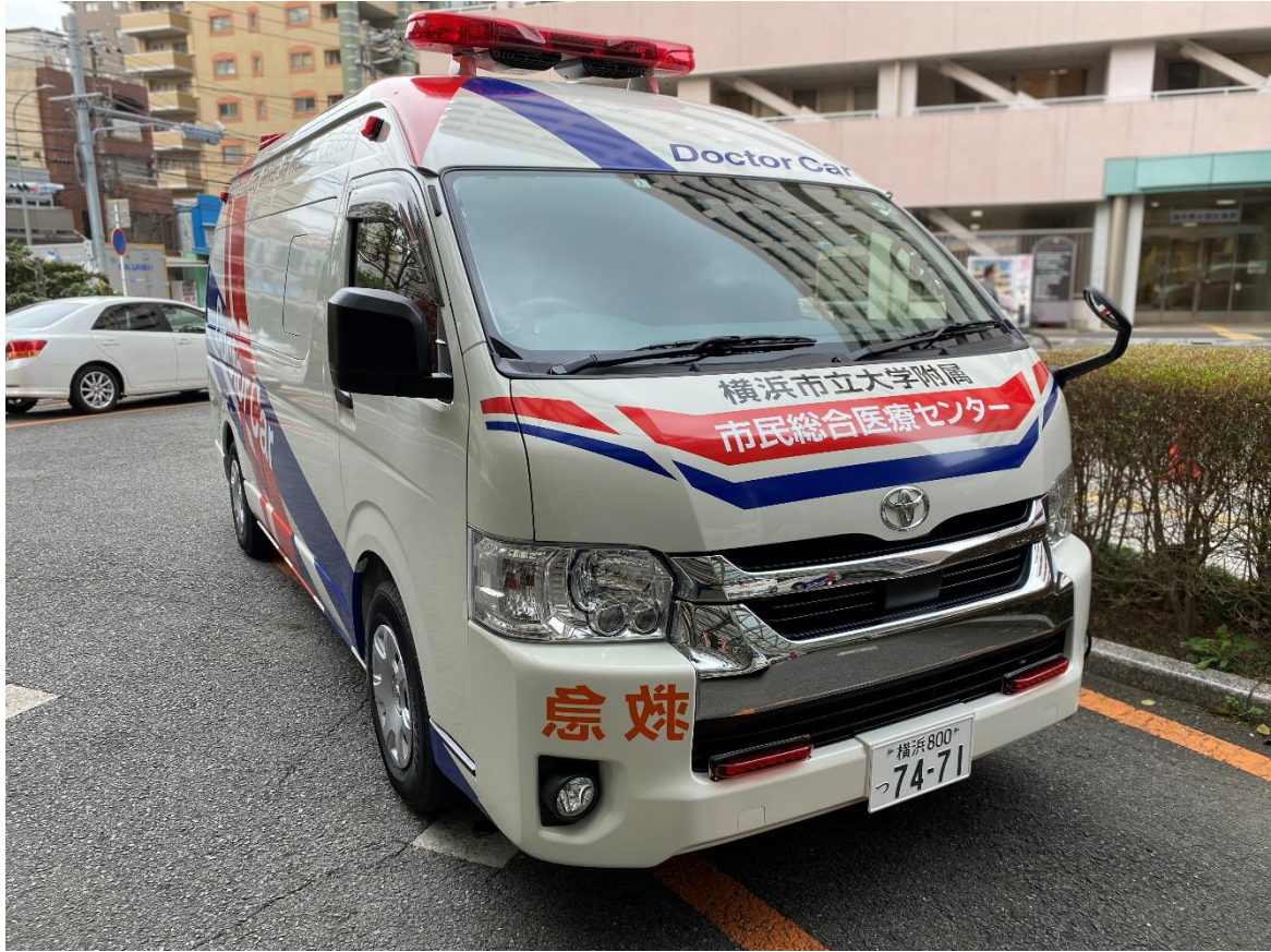
(1) 現場へ医師・看護師を派遣するドクターカー 1台