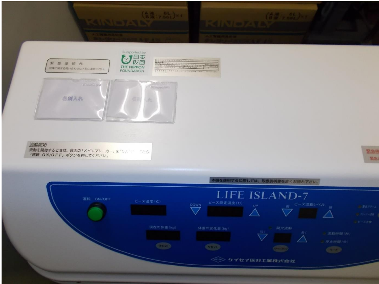
(3) 生体情報モニタシステム 一式