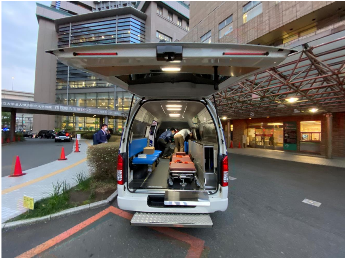
(2) 専用フローティングベッド 1台