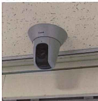
ネットワークカメラ:ICU9