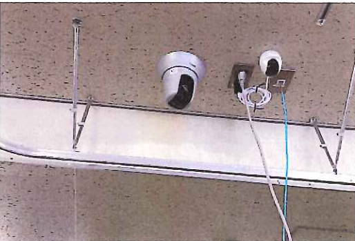
ネットワークカメラ: 101-9