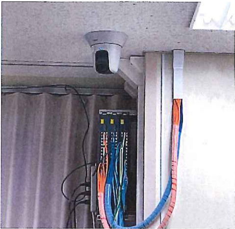
ネットワークカメラ: 処置室1