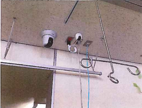
ネットワークカメラ: 101-8