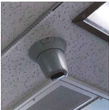
ネットワークカメラ:ICU9