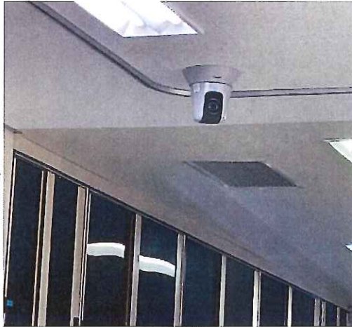
ネットワークカメラ: 処置室3