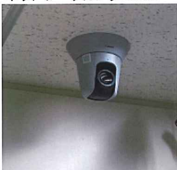
ネットワークカメラ:ICU8