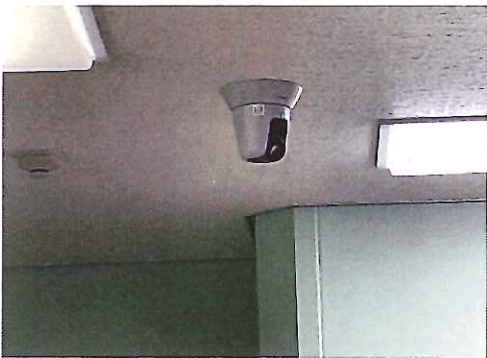
ネットワークカメラ: 手術室