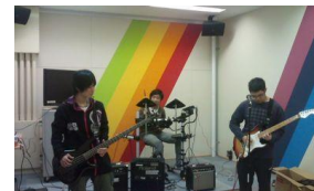
近くの高校生たち

◇支援員の数を増やして、付きっきりで対応してほしい。 → 現状では不可能ですが、事前に予約してもらいますと時間を区切った対応であれば可能です。 また、市民ボランティアも募集中です。 (メンバーと一緒に話したり、お茶飲んだり、卓球したり、遊んでくださる方)