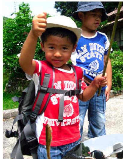
これはハエっていうんだよ～

日時：7月17日(日) 主催： とみやまちょう 富山町ふるさとづくり21 すいしんきょうぎかい 推進協議会・ あしやがわ 東部まちづくり委員会 場所：富山町芦谷川