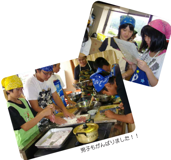
男子もがんばりました！！

8月、中高生対象の料理教室が開かれました。中学生、高校生、大学生の16人が参加。3人の栄養士さんから、バランスのよい食事について、大さじ・小さじ、1カップなどの基礎知識、野菜の保存方法、料理が美味しくなるテクニックなども教わっていました。