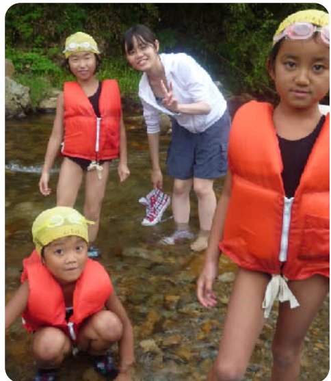
川をせきとめとるんだよ。