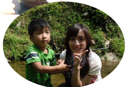
おかあさんと川遊び♪