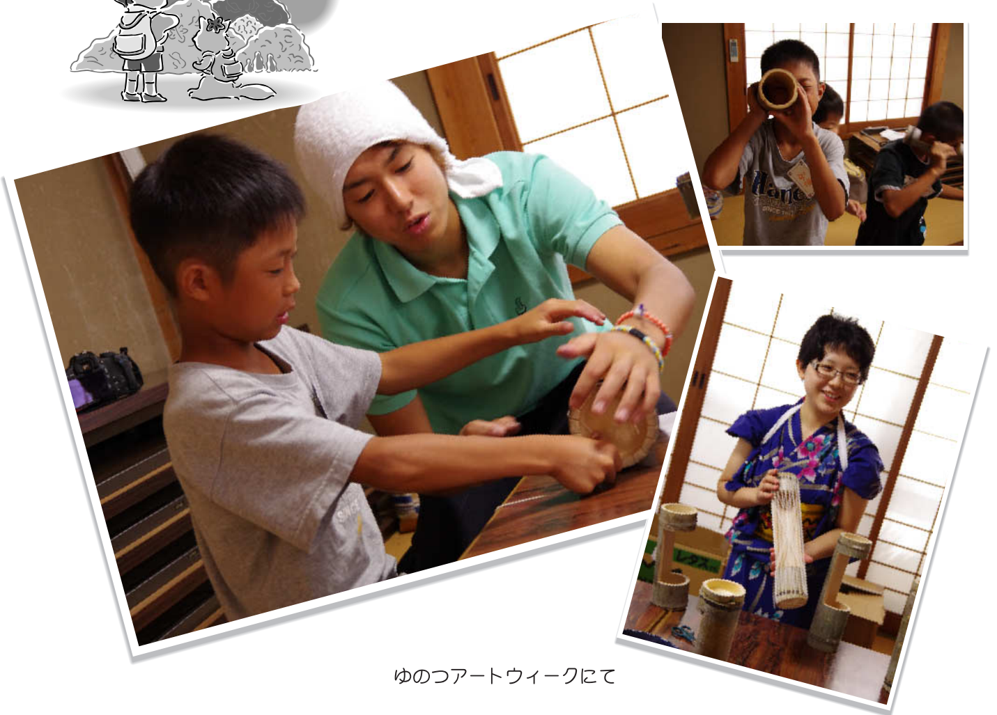
ゆのつアートウィークにて

「あそびたいがあ〜」は「遊びたいよね」を意味する大田地方の方言です。大田市内の子どもたちが積極的に放課後や休日に地域での活動に参加し、地域の「ひと」「もの」「こと」に触れ、体験し、学ぶことで、心豊かでたくましい子どもに育ててほしいという願いが込められています。[大田市教育委員会委託事業]