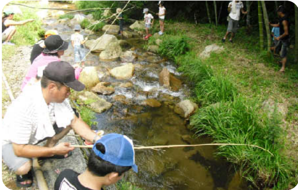
川の上には竹竿がたっくさん! とみやま けいりゅう 富山の渓流でヤマメ釣り! あしやがわ じょうりゅうぶ 芦谷川の上流部に

集まった参加者は、なんと130人!!お父さんやお母さん、おじいちゃんやおばあちゃんに連れられて、みんな遊びにきていました。