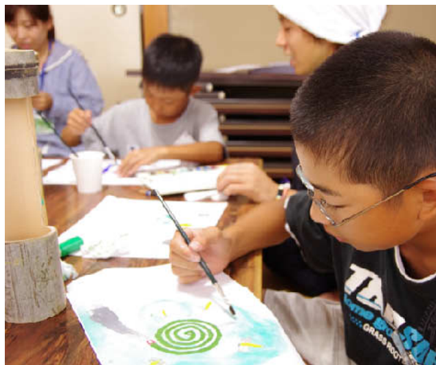
竹灯籠の絵付けをしております。

竹灯籠づくりでは、真ん中をくり抜いた 竹筒に、①和紙に絵を描いて覆うタイプ、 ②糸を張りめぐらせるタイプがあり、中に 灯りを入れて海神楽本番で飾るものを作り ました。わきあいあいと楽しい雰囲気の中で、 とても芸術的なものができあがります。こ れも地元の方や京都造形芸術大学の学生さ んがとても熱心だからですね…☆きっと良 い体験ができるので、参加してみたいな と思ったら来年は足を運んでみてください。