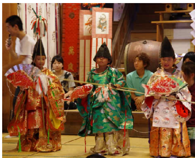
子ども達も神楽を披露！