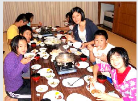
今日の夕飯はへか焼き♪

山村留学の子どもたちが、農作業の成果や個人体験の発表をします。農作物の収穫をお祝いした「感謝の式」や太鼓の演奏、演劇の発表、保護者によるバザーや模擬店などもあります。