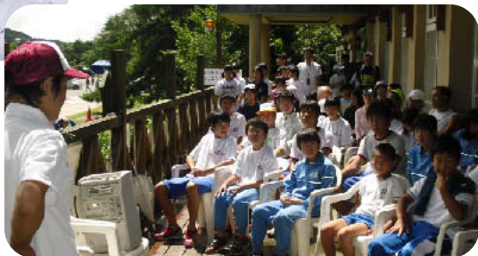
ねっしん 熱心に聞いています