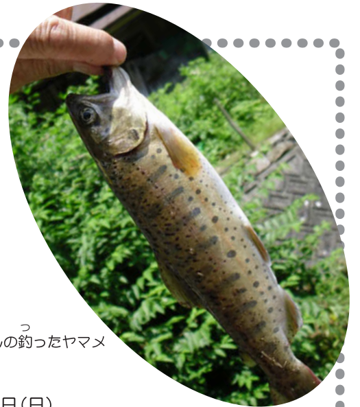
おじさんの釣ったヤマメ

おなか一杯になると、また川に戻って水遊び。服はびしょびしょ、足下はじゃぶじゃぶ。サンサンと照るお日さまの下で、みんな元気いっぱいでした。