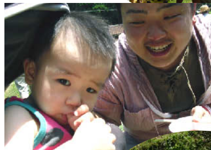
そうめんおいしいなあ