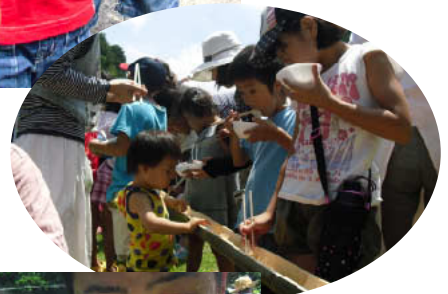
竹が見えませんが!!