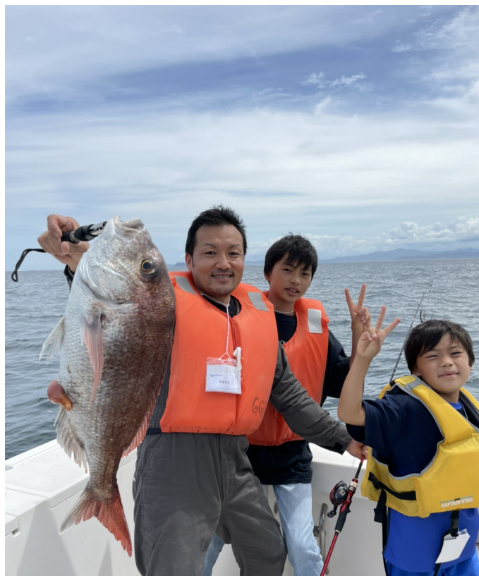
パパも子供も大物をGet