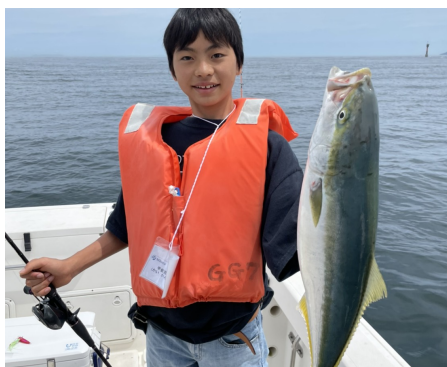
大きなブリも釣れちゃった