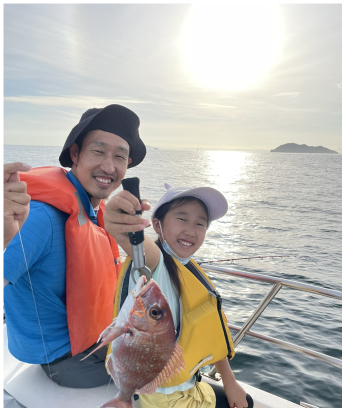
真鯛を釣り上げ喜ぶ親子

任意団体Mfisea（エムフィッシャー）は、日本の海が直面している問題をクイズ形式で楽しみながら学習するとともに、実際の船釣り（真鯛釣り：タイラバ）体験を通じて海や魚を愛する気持ちを育むイベント、「親子のための大分の海を学ぶツアー」を2021年7月25日に開催いたしました。このイベントは、次世代へ海を引き継ぐために、海を介して人と人がつながる“日本財団「海と日本プロジェクト」”の一環です。