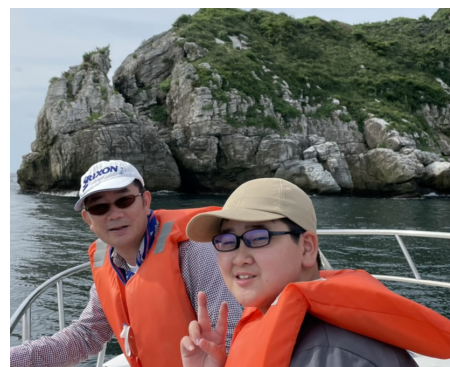
クルージングだけでも最高