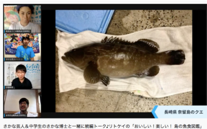
さかな芸人&中学生のさかな博士と一緒に続編トーク・リトケイの「おいしい!楽しい!島の魚食図鑑」

市)で高級魚・クエが釣れた思い出や、お腹の中で卵をかえずマタナゴや、興奮すると赤くなる習性があり沖縄では「グルクン」の名でおなじみのタカサゴなど、魚の面白い習性も紹介されました。