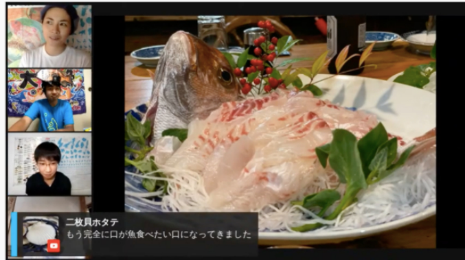
さかな芸人&中学生のさかな博士と一緒に統編トーク・リトケイの「おいしい!楽しい!島の魚食図鑑」

https://www.youtube.com/watch?v=frmAdi99eI0