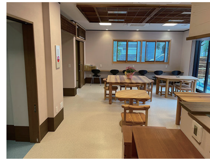
コミュニティカフェ