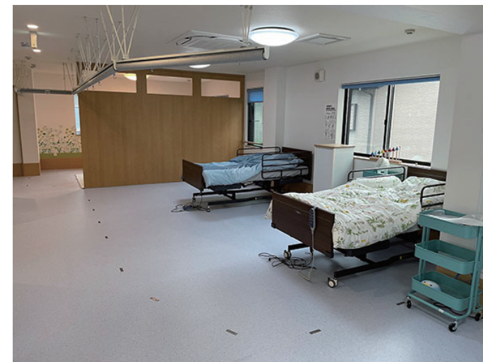
日中一時支援エリア（奥）・短期入所エリア（手前）