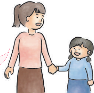
Aさん(仮名) 難聴児(小学生)の保護者

私 も、我が子が難聴で生まれたときは、とてもショックでした。病院からすぐにろう学校へ向かうと、生徒たちが手話言語で生き生きと語り合っていました。手話言語で子育てしよう!と決めた瞬間でした。その後、我が子は、ろう学校を選び、友達や先輩と手話言語で意見を交わせるようになりました。子どもの将来に不安を感じることもありますが...でも、聞こえない方々や先生、いろいろな方々があなたやお子さんをサポートしてくれますよ。ともに前を向いて歩いていきましょう!