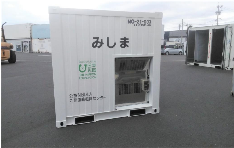
三島村 (鹿児島～三島～枕崎)