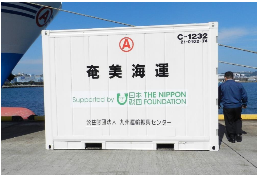
奄美海運(株) (鹿児島～喜界～知名航路)