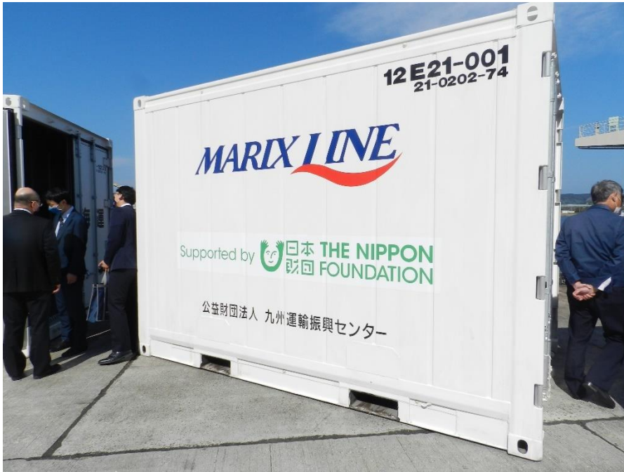
マリックスライン(株) (鹿児島～奄美～那覇航路)