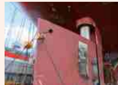
舵は船の進路を操る基幹装置の1つ