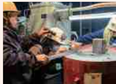
舵取機の取付作業

船のエンジンや舵取機、プロペラ、発電機などの取付やメンテナンスを行います。どれも船の安全な航行に欠かせない基幹装置で、人間に例えるなら「心臓部」。もしそこでトラブルが生じてしまったら、船は動かなくなるリスクも。それを回避し、船員たちの命を支える重要な仕事です。