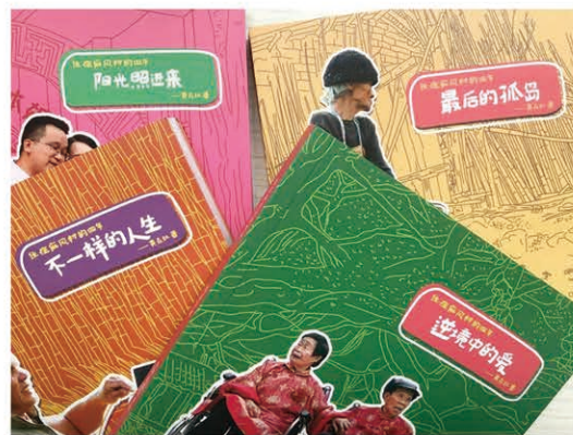
【康福·新书】《住在麻风村的四年》

本消除，成为一段尘封的历，麻风康复老人的顽强生命故事，将通过这套书籍在历史中得到铭记。