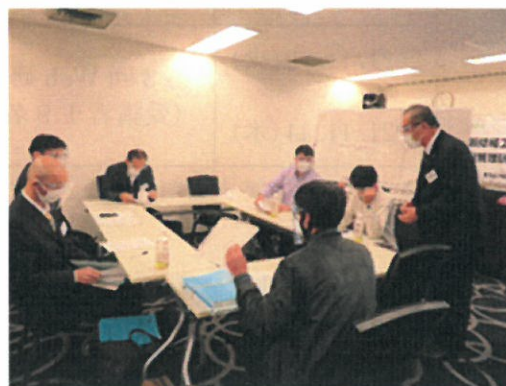
グループ討議の様子

対象となる船用機器修繕工事管理者に対し、参加を要請して東京都内の会場で新型コロナウイルスの感染拡大の防止対策を講じて開催した。その結果、13事業場の22名が参加した。研修会は2日間で、レポート審査の結果、参加者全員が資格更新について適格であると評価され、修繕工事管理者に相応しい品質管理技術の維持、向上を図ることができた。