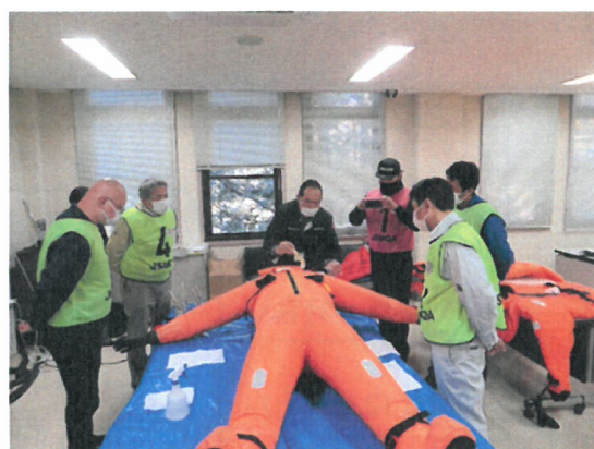
実技講習 (気密試験)