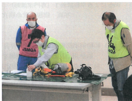
実技講習 (個人装具)