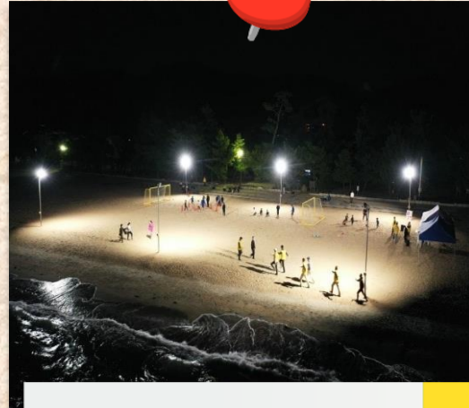
海にナイターを設置