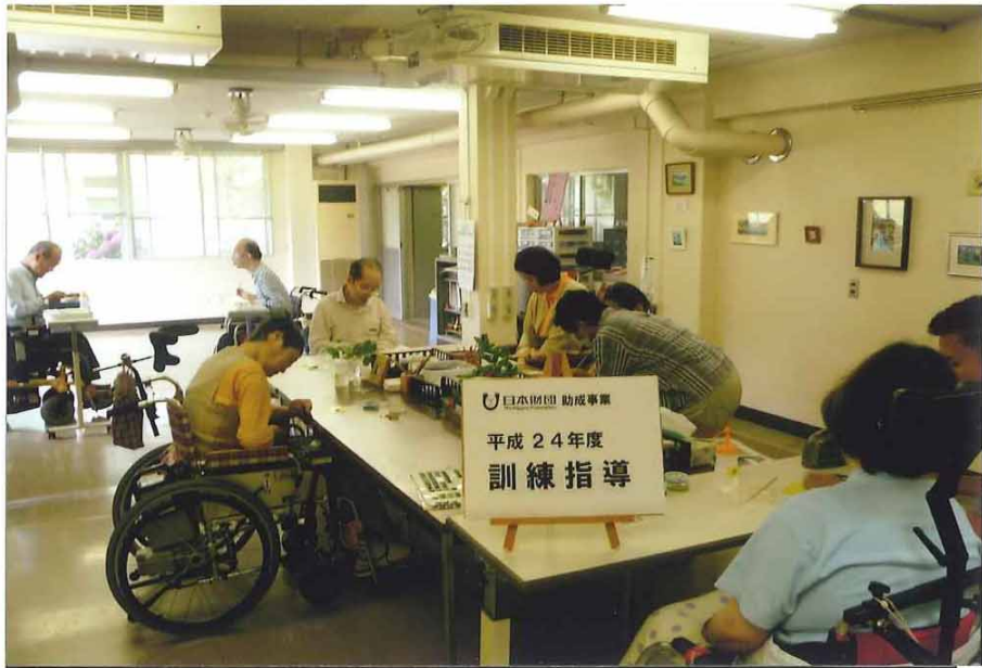
事業の実施状況写真