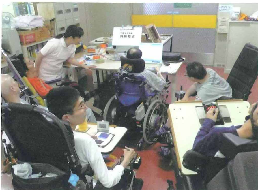
事業の実施状況写真