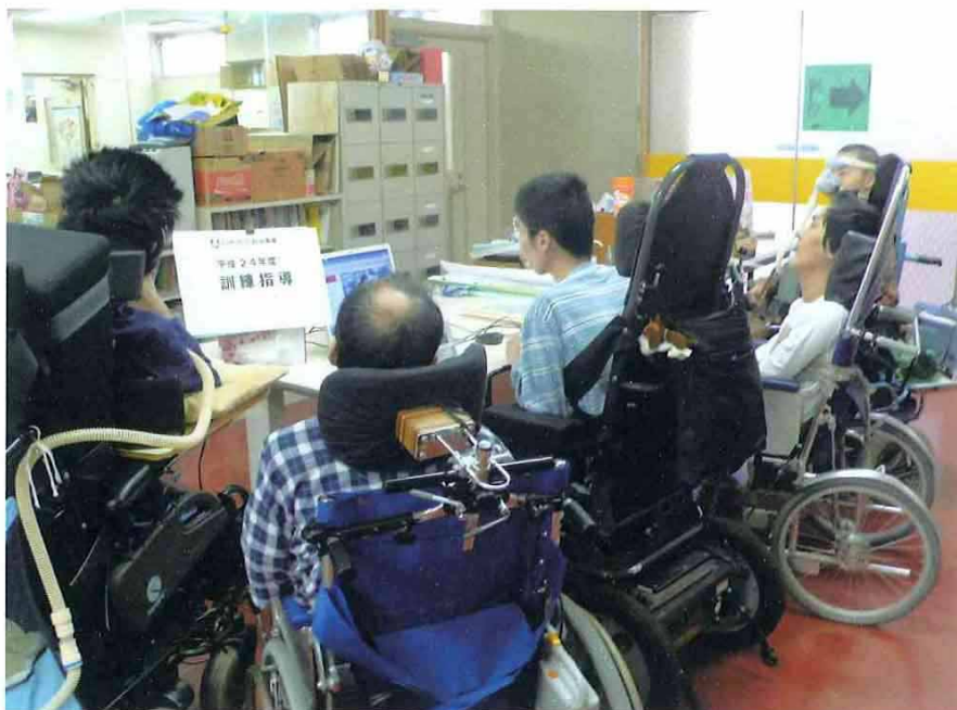
事業の実施状況写真