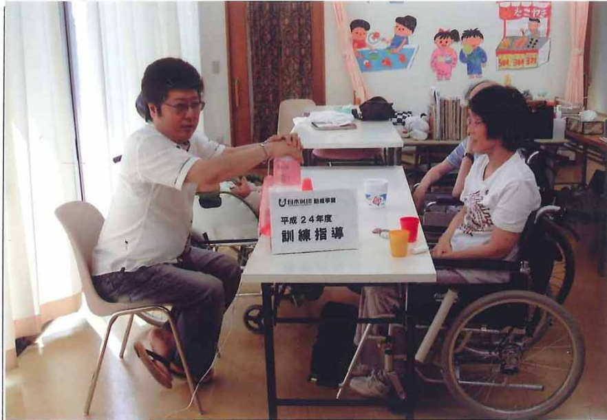
事業の実施状況写真