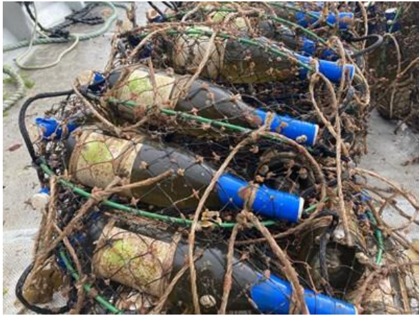
海中から引き揚げられたワイン