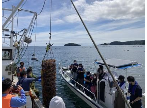
引き上げ体験イベントの様子