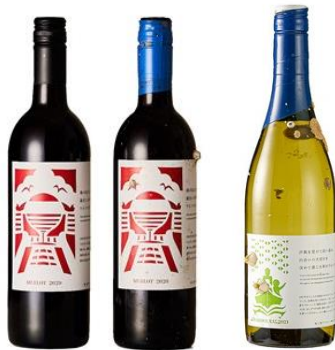
(左):メルロ(赤)飲み比べセット (右):シャルドネ(白)単体