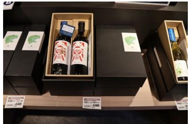
販売の様子(化粧箱に入ります)