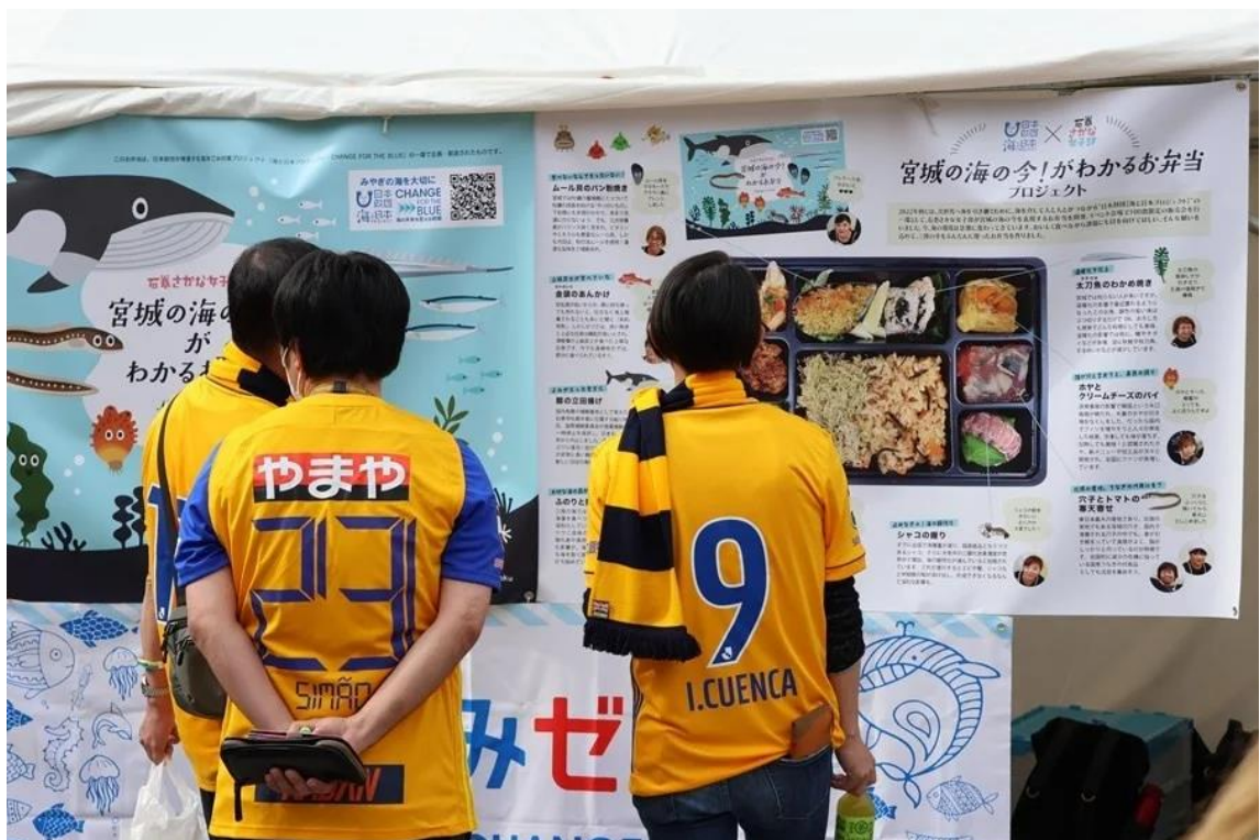
お弁当裏蓋の展示を見るサポーター