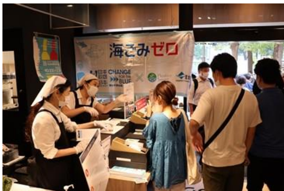
飲み比べセットの試飲会を開催