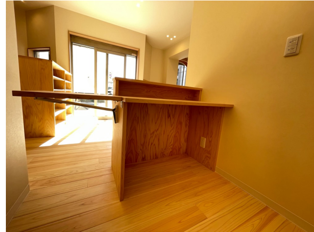
受付カウンター、奥玄関