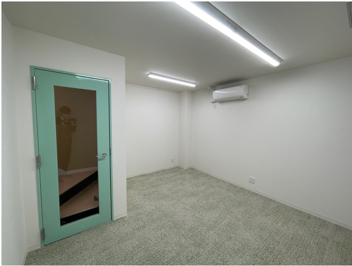
入り口付近から見た事務所内