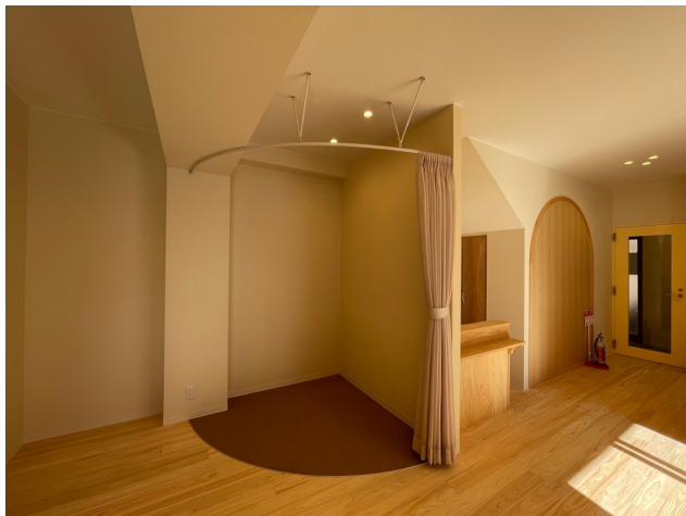
人を感じながら一人になれる場