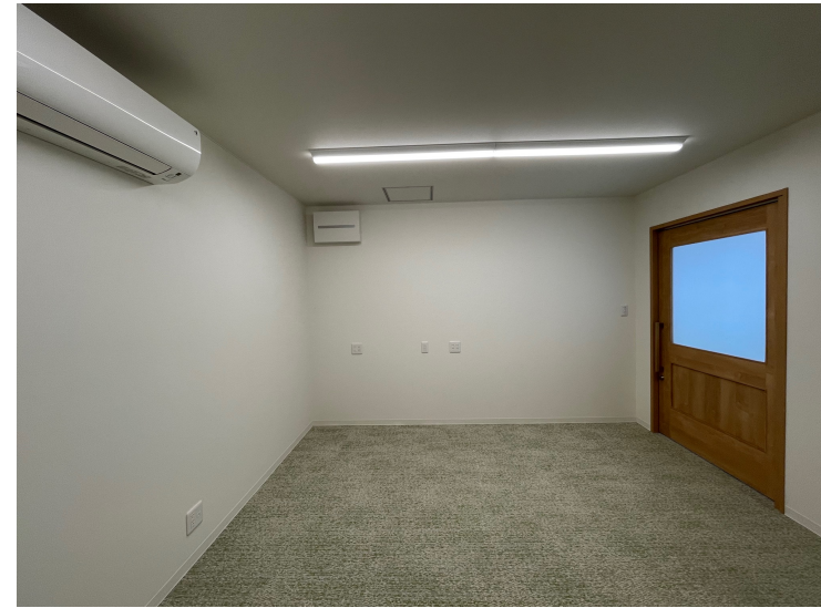
事務所奥からみた入り口