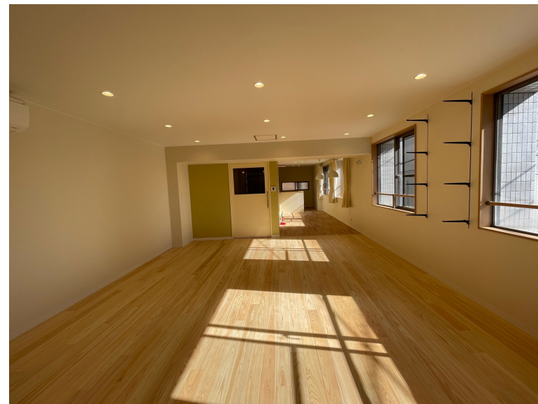
学習スペースから見たキッチン