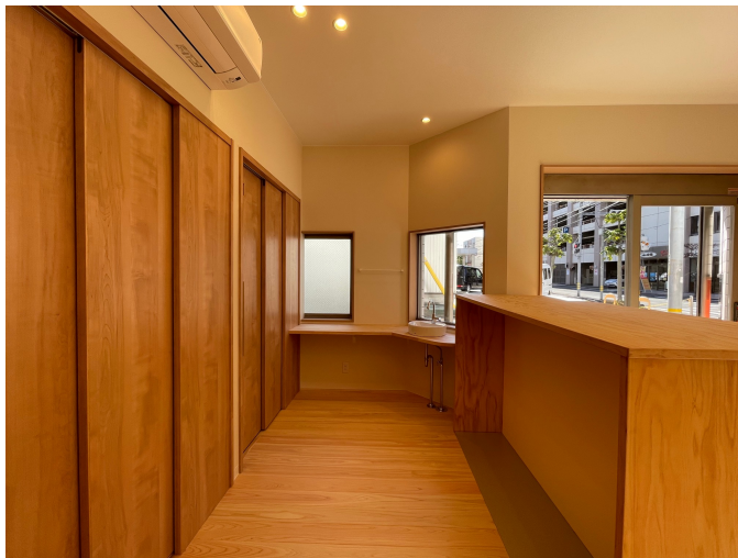
1Fトイレ前 左手前扉 男子 トイレ、左奥扉女子トイレ