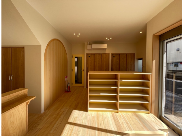
奥トイレ扉 玄関と靴箱、左手前 受付カウンター