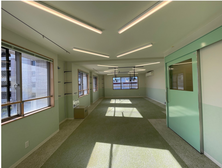
入り口付近から見た静かに過ごせる場