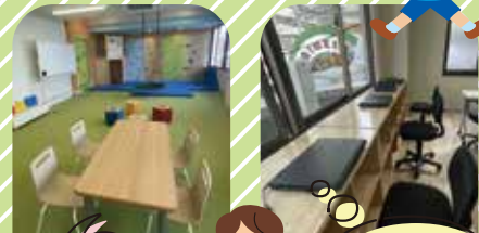
広い空間で、のびのびと過ごすことができます。