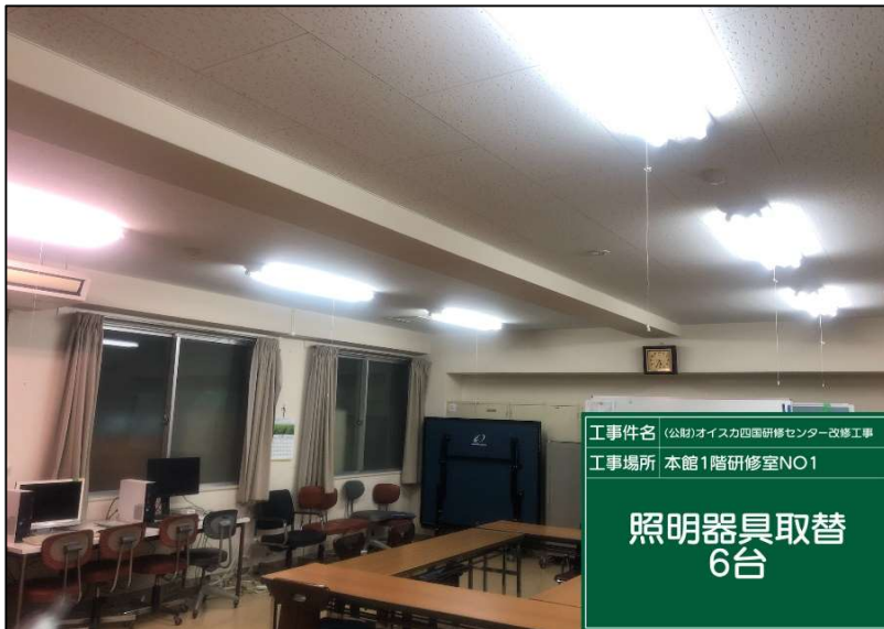
No.: 29 工種: 電気設備工事 測点: 1階研修室

工事件名 (公財)オイスカ四国研修センター改修工事 工事場所 1階廊下 照明器具取替