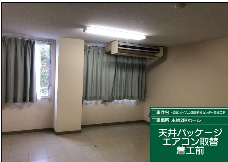
No.: 48 工種: エアコン取替工事 測点: 2階研修室