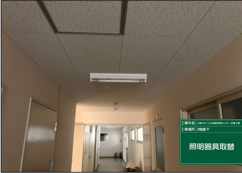
No.: 40 工種: 電気設備工事 測点: 本館2階廊下