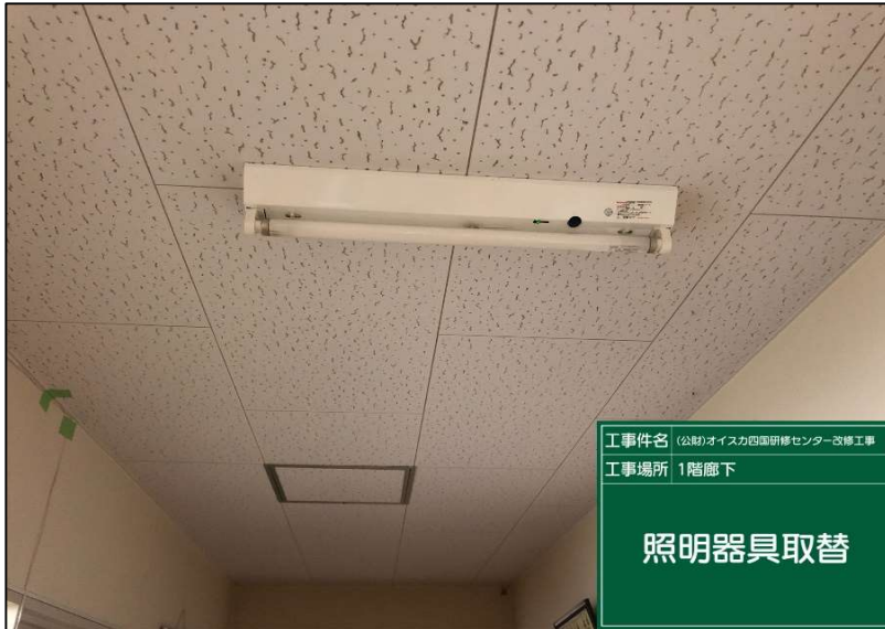
No.: 28 工種: 電気設備工事 測点: 1階廊下

工事件名 (公財)オイスカ四国研修センター改修工事 工事場所 1階廊下 照明器具取替