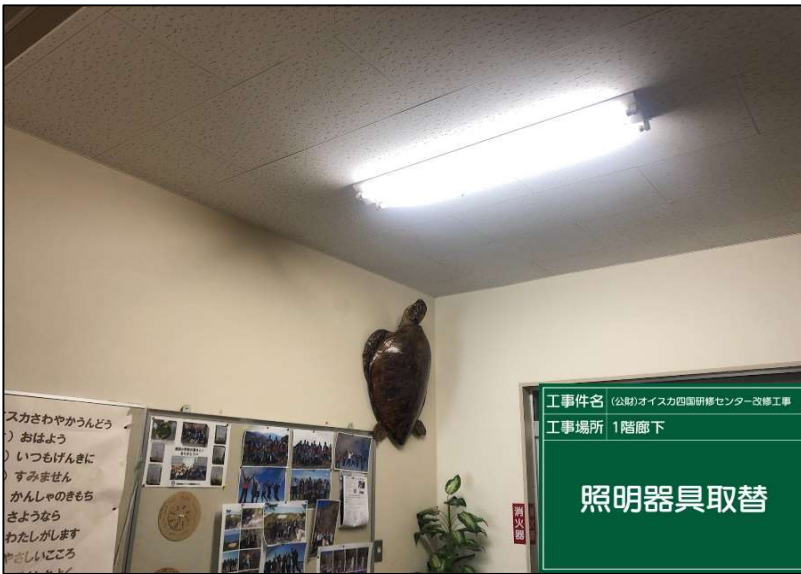
No.: 26 工種: 電気設備工事 測点: 1階廊下