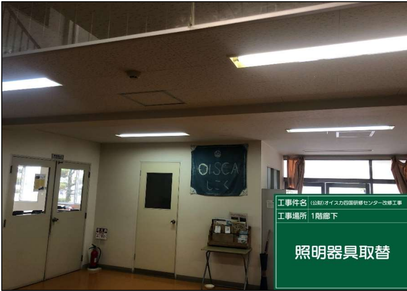
No.: 25 工種: 電気設備工事 測点: 1階廊下