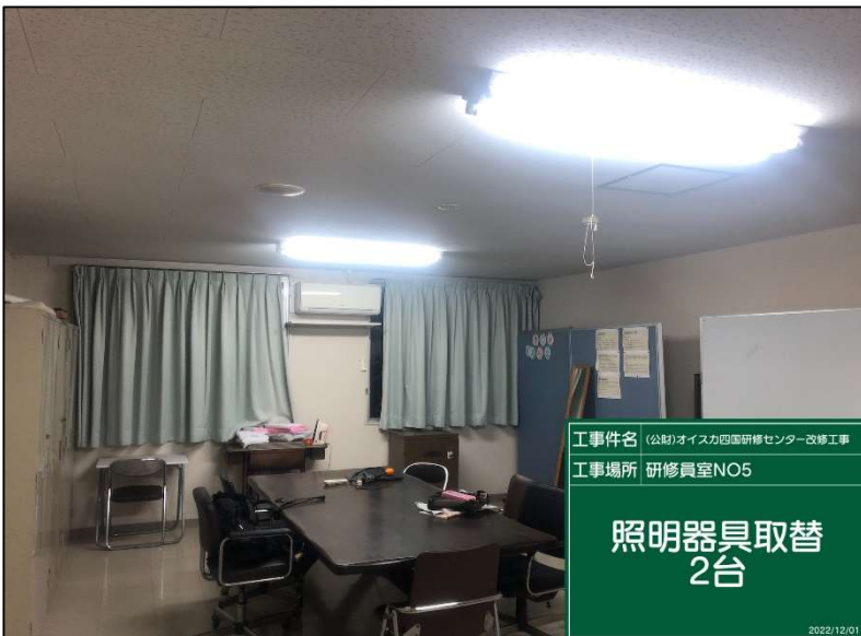
No.: 34 工種: 電気設備工事 測点: 本館2階研修員室