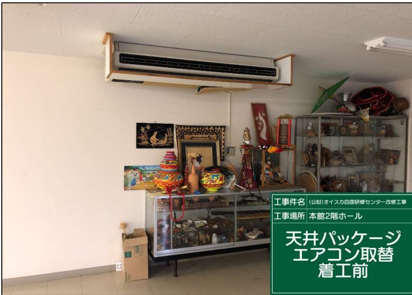
No.: 50 工種: エアコン取替工事 測点: 2階研修室