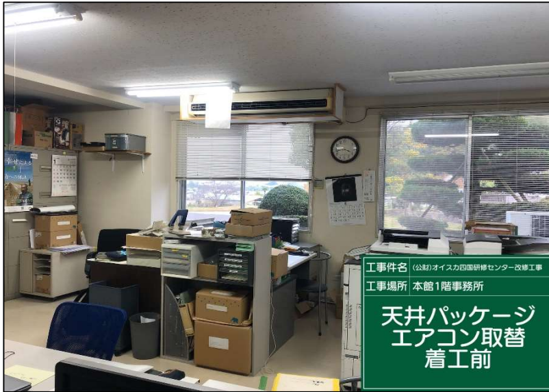
No.: 46 工種: エアコン取替工事 測点: 1階事務所