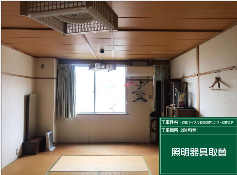
No.: 35 工種: 電気設備工事 測点: 本館2階和室