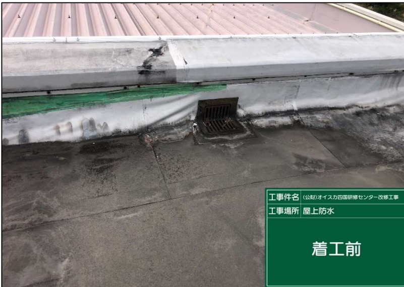
No.: 8 工種: 防水工事 測点: 本館屋上