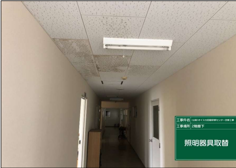
No.: 41 工種: 電気設備工事 測点: 本館2階廊下