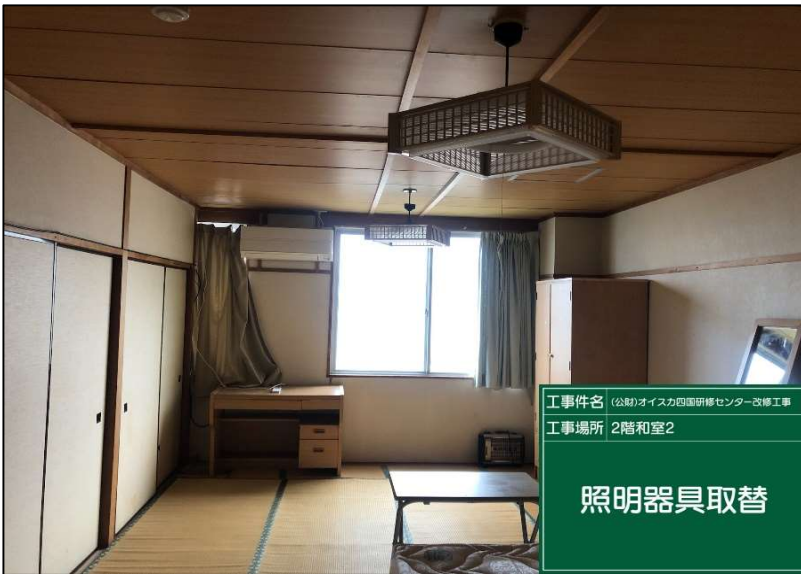
No.: 36 工種: 電気設備工事 測点: 本館2階和室