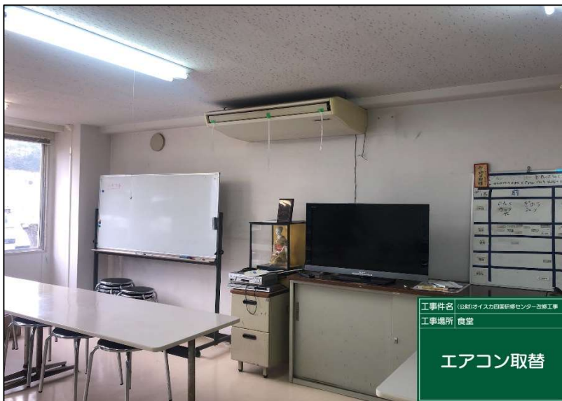
No.: 47 工種: エアコン取替工事 測点: 1階食堂