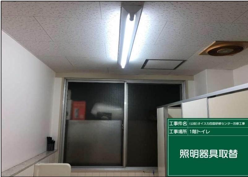
No.: 33 工種: 電気設備工事 測点: 1階トイレ