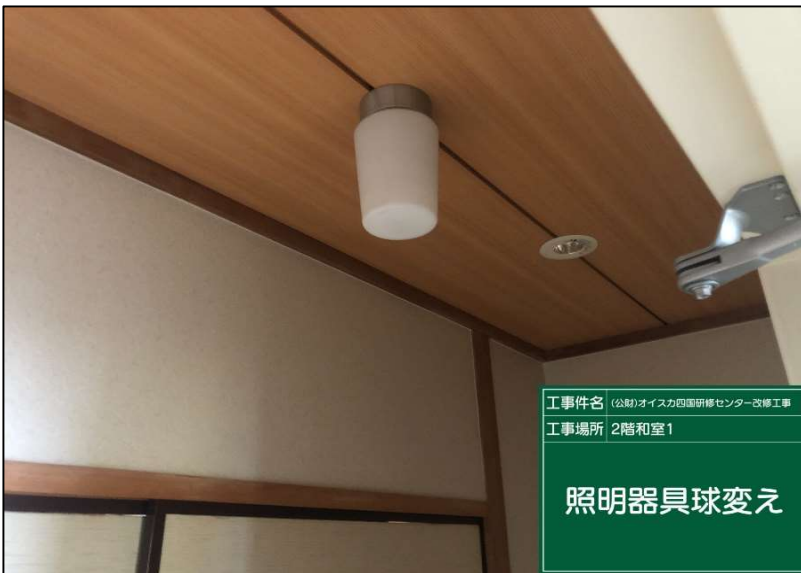
No.: 37 工種: 電気設備工事 測点: 本館2階和室