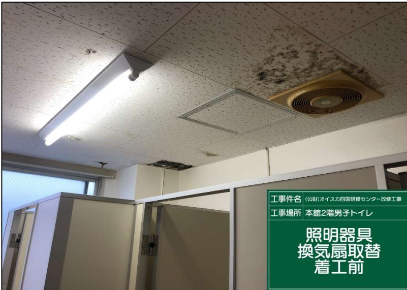
No.: 42 工種: 電気設備工事 測点: 2階男子トイレ