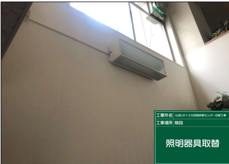
No.: 27 工種: 電気設備工事 測点: 1階廊下