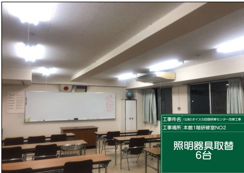
No.: 30 工種: 電気設備工事 測点: 1階研修室

工事件名 (公財)オイスカ四国研修センター改修工事 工事場所 本館1階研修室NO1 照明器具取替 6台