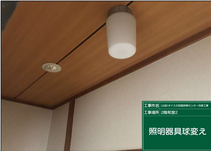
No.: 38 工種: 電気設備工事 測点: 本館2階