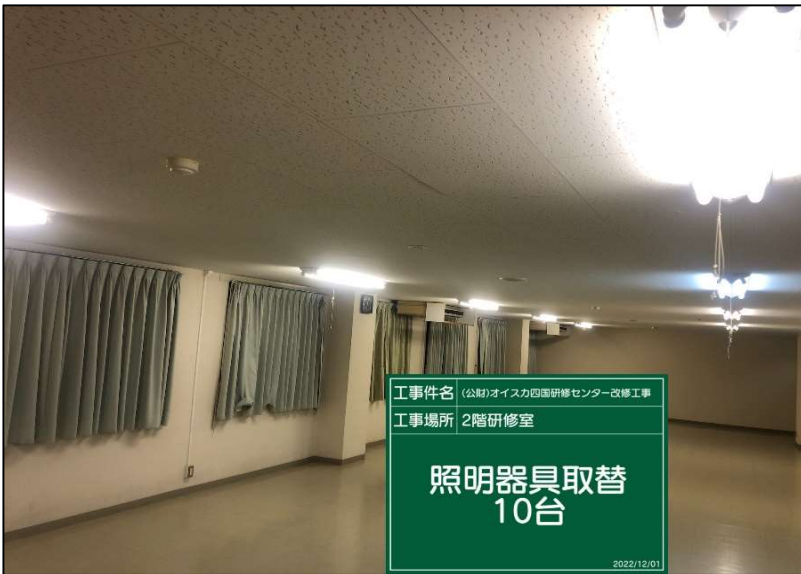
No.: 34 工種: 電気設備工事 測点: 本館2階研修室