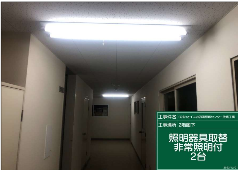
No.: 39 工種: 電気設備工事 測点: 本館2階廊下