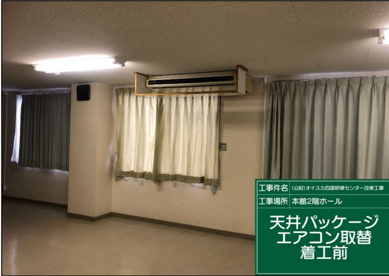
No.: 49 工種: エアコン取替工事 測点: 2階研修室