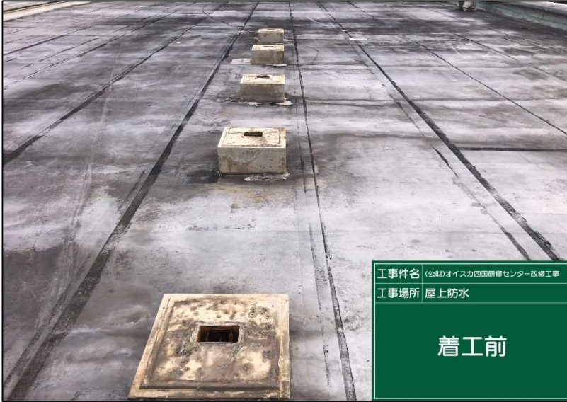
No.: 7 工種: 防水工事 測点: 本館屋上