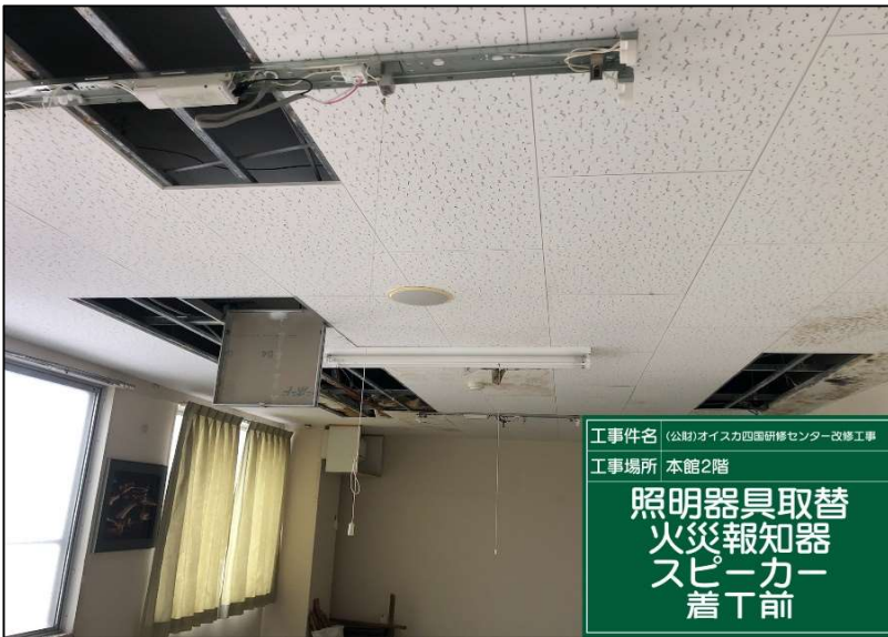
No.: 38 工種: 電気設備工事 測点: 本館2階