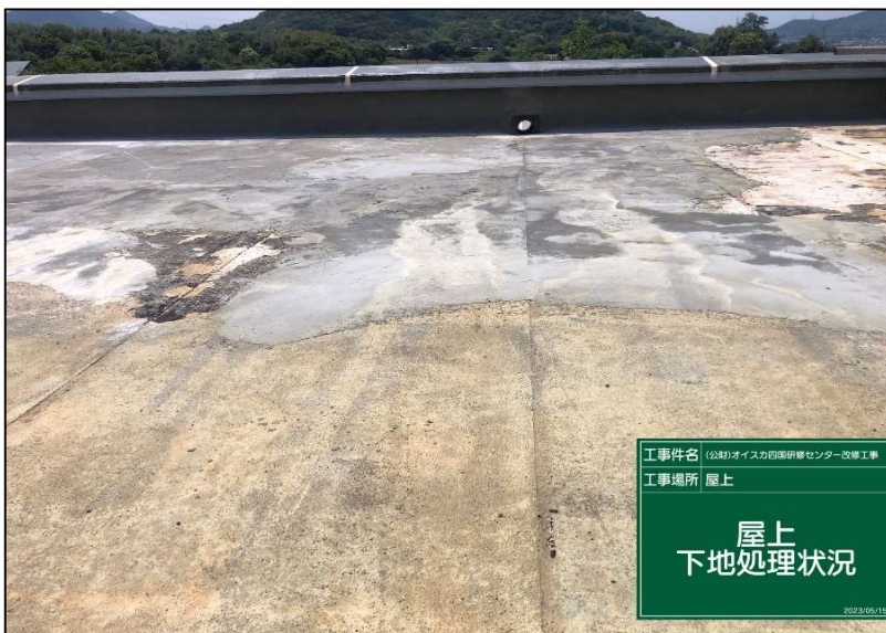
No.: 9 工種: 防水工事 測点: 本館屋上