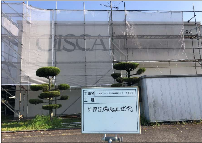
No.: 4 工種: 仮設工事 測点: 外部足場組立状況