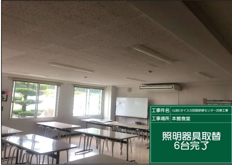
No.: 49 工種: 電気設備工事 測点: 1階食堂