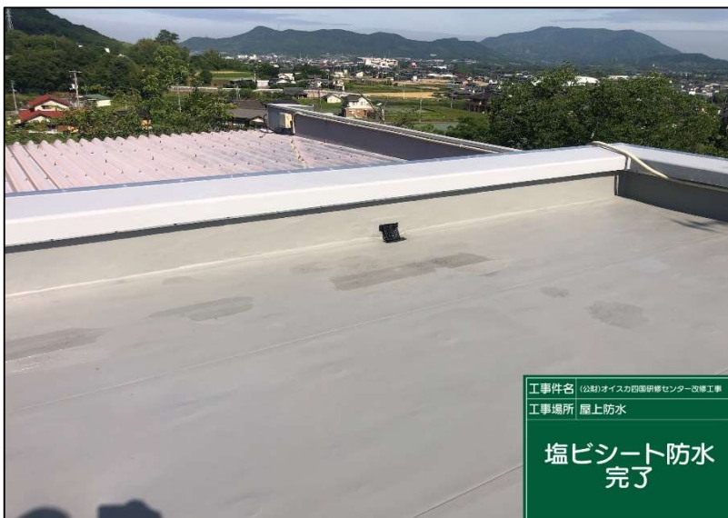
No.: 15 工種: 防水工事 測点: 本館屋上