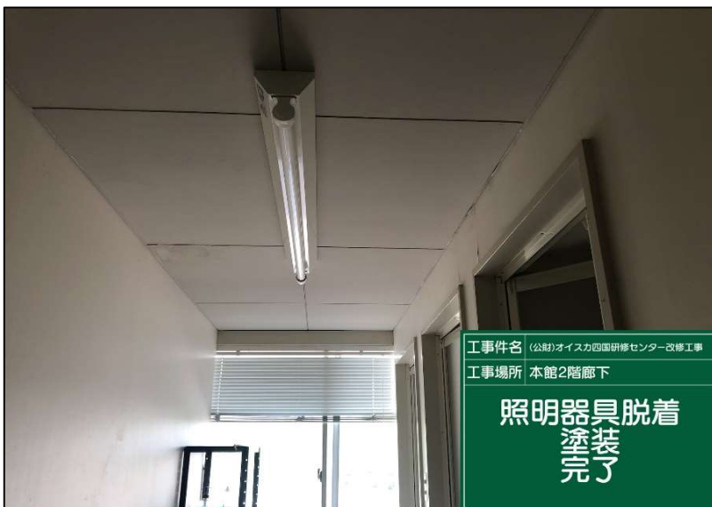
No.: 66 工種: 電気設備工事 測点: 2階シャワールーム