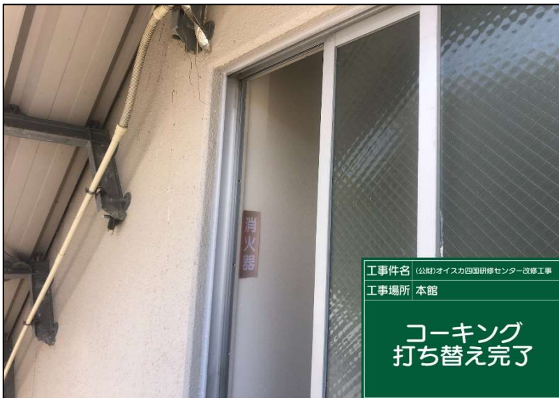
No.: 24 工種: 防水工事 測点: