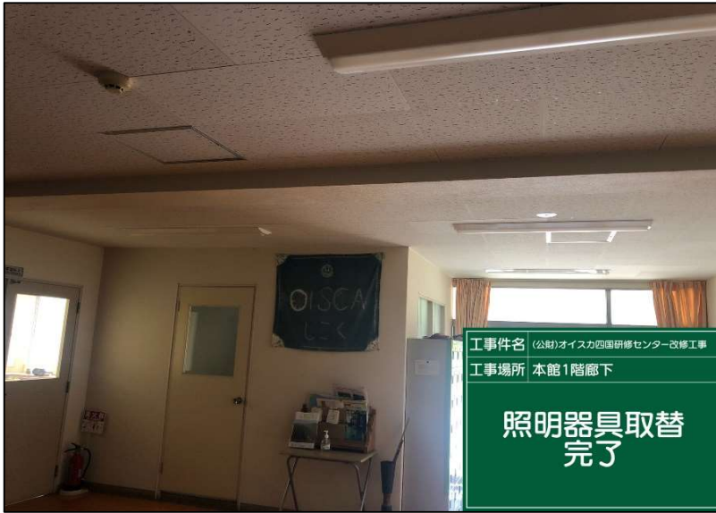
No.: 43 工種: 電気設備工事 測点: 1階廊下