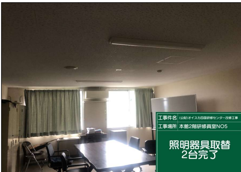
No.: 54 工種: 電気設備工事 測点: 2階研修員室