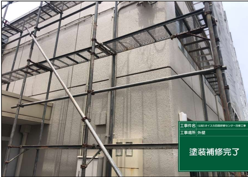
No.: 31 工種: 外壁改修工事 測点: