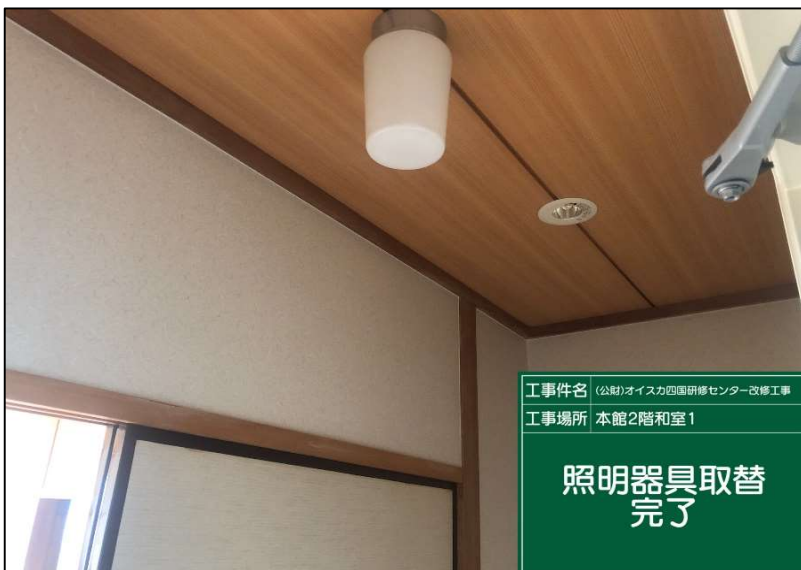
No.: 57 工種: 電気設備工事 測点: 本館2階和室 照明器具球替え