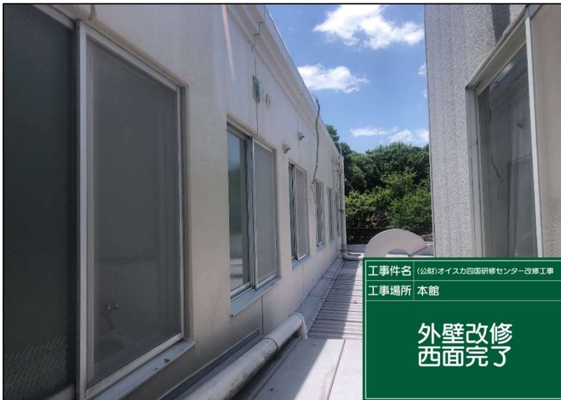
No.: 32 工種: 外壁改修工事 測点: