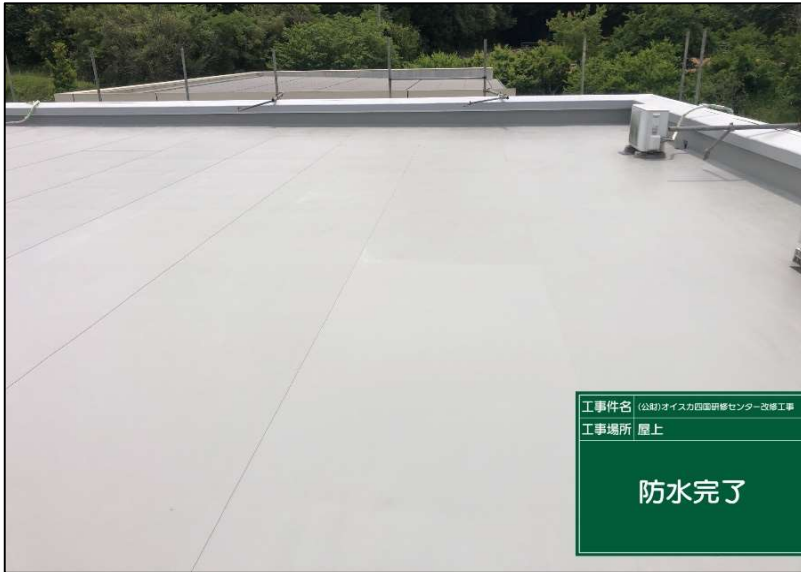
No.: 13 工種: 防水工事 測点: 本館屋上