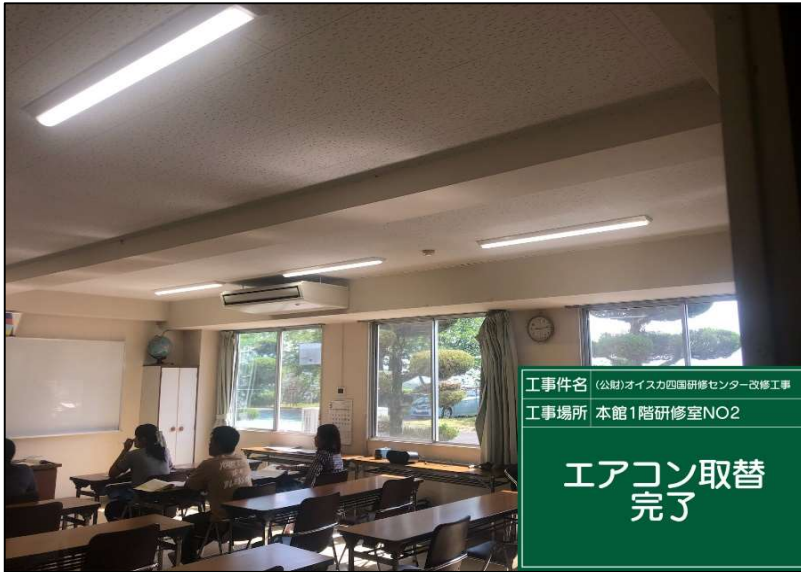
No.: 67 工種: エアコン取替工事 測点: 1階研修室NO2