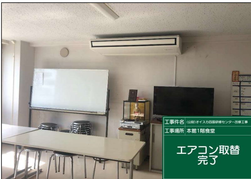
No.: 69 工種: エアコン取替工事 測点: 1階食堂