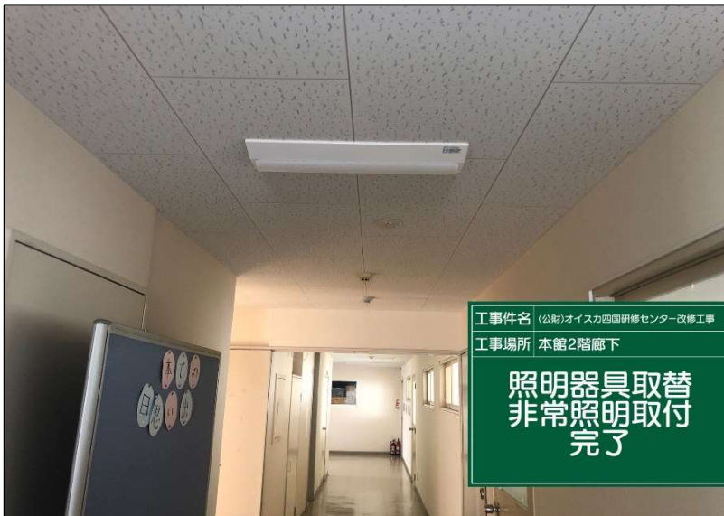
No.: 59 工種: 電気設備工事 測点: 本館2階廊下