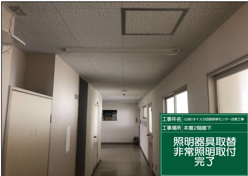
No.: 62 工種: 電気設備工事 測点: 本館2階廊下