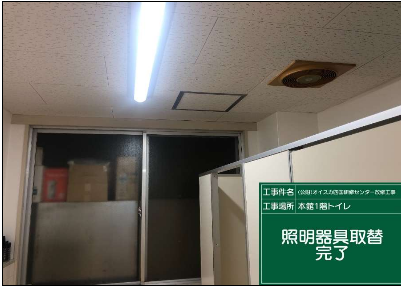
No.: 52 工種: 電気設備工事 測点: 1階トイレ