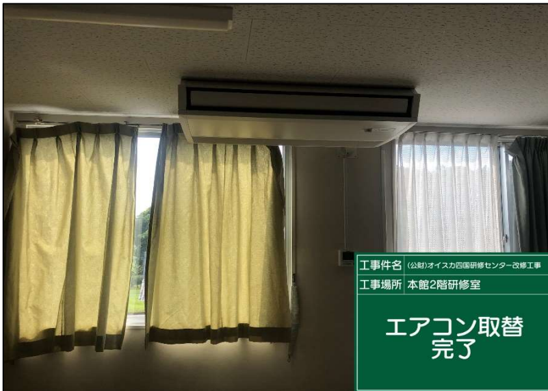
No.: 71 工種: エアコン取替工事 測点: 2階研修室