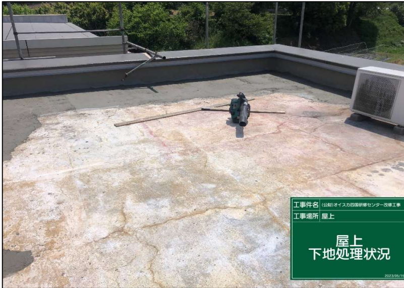
No.: 10 工種: 防水工事 測点: 本館屋上