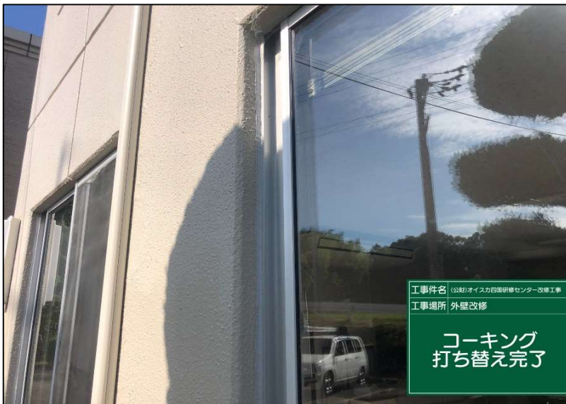
No.: 18 工種: 防水工事 測点: