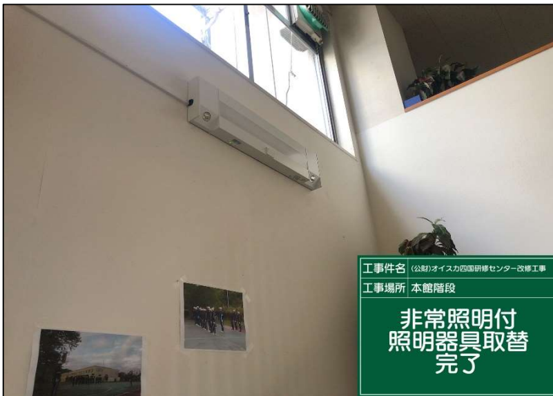
No.: 45 工種: 電気設備工事 測点: 1階廊下