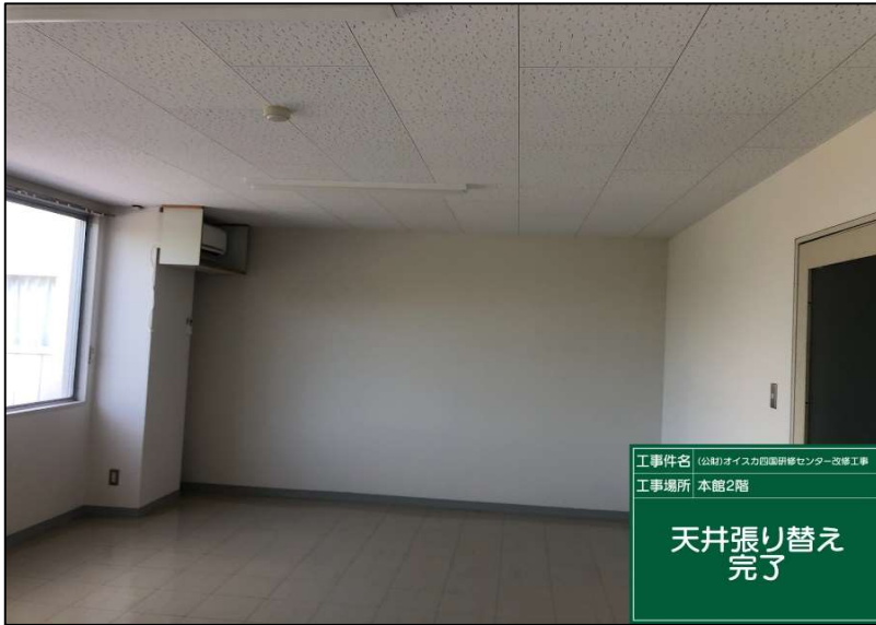
No.: 34 _____ 工種: 測点: 研修員室NO7