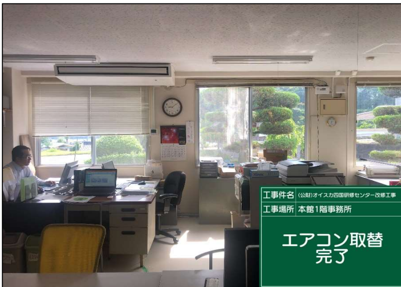
No.: 68 工種: エアコン取替工事 測点: 1階事務所