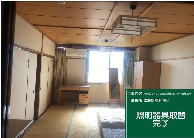
No.: 56 工種: 電気設備工事 測点: 本館2階和室