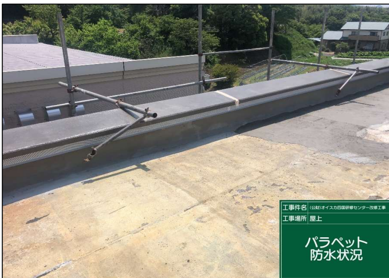
No.: 12 工種: 防水工事 測点: 本館屋上