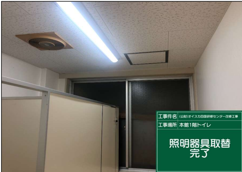
No.: 51 工種: 電気設備工事 測点: 1階トイレ