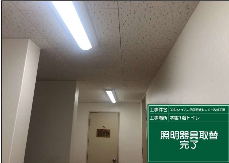
No.: 50 工種: 電気設備工事 測点: 1階洗面