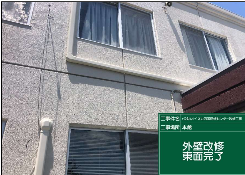
No.: 26 工種: 外壁改修工事 測点: