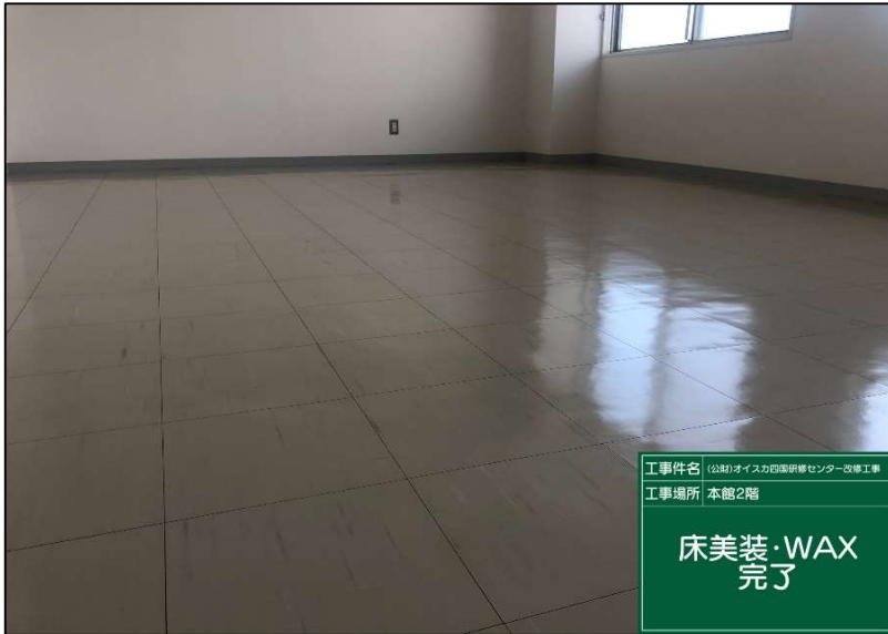
No.: 37 工種: 測点: 研修員室NO7

工事件名 (公財)オイスカ国際研修センター改修工事 工事場所 本館2階 床美装・WAX 完了