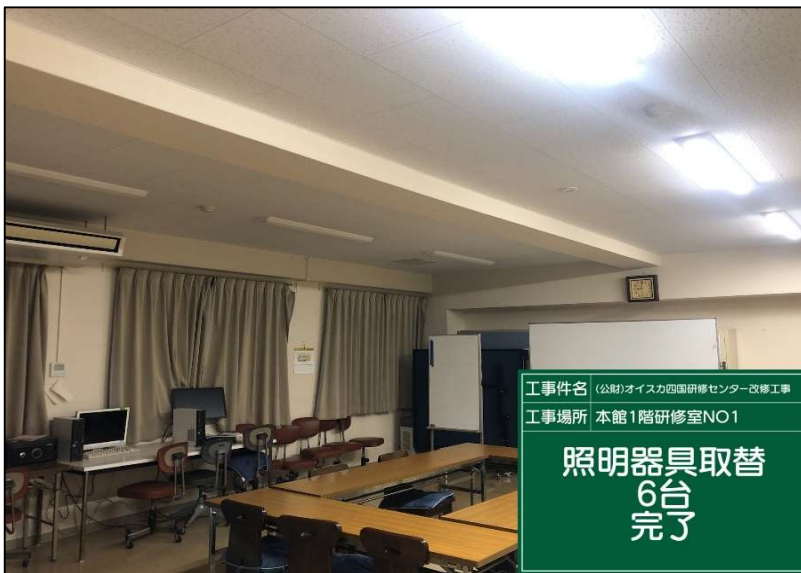
No.: 47 工種: 電気設備工事 測点: 1階研修室