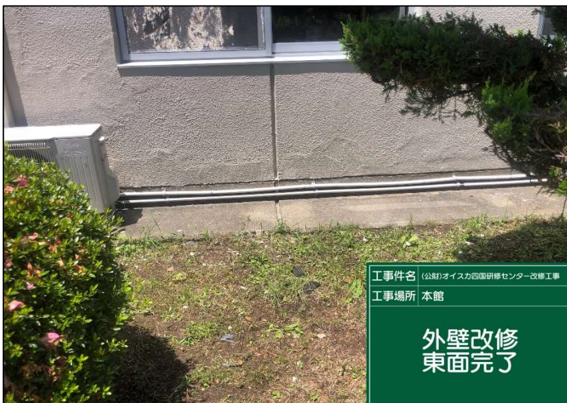
No.: 27 工種: 外壁改修工事 測点: