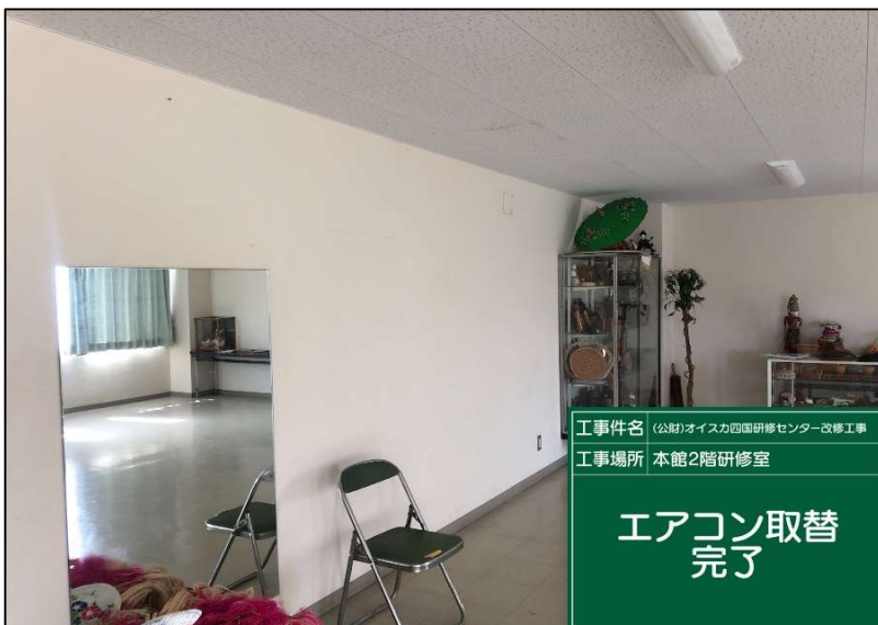
No.: 72 工種: エアコン取替工事 測点: 2階研修室