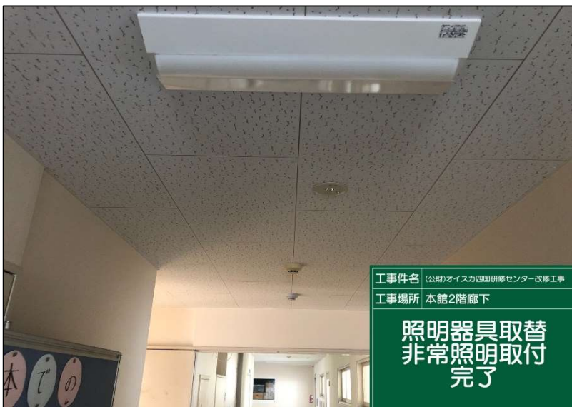
No.: 60 工種: 電気設備工事 測点: 本館2階廊下