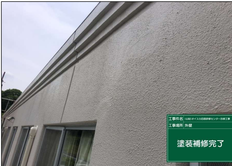
No.: 29 工種: 外壁改修工事 測点: