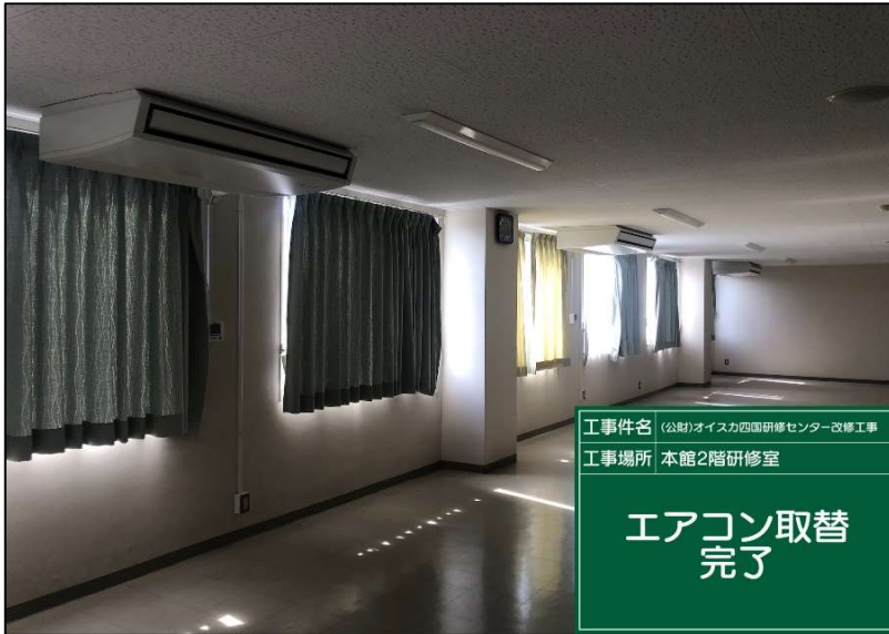
No.: 70 工種: エアコン取替工事 測点: 2階研修室