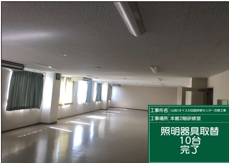
No.: 53 工種: 電気設備工事 測点: 2階研修室