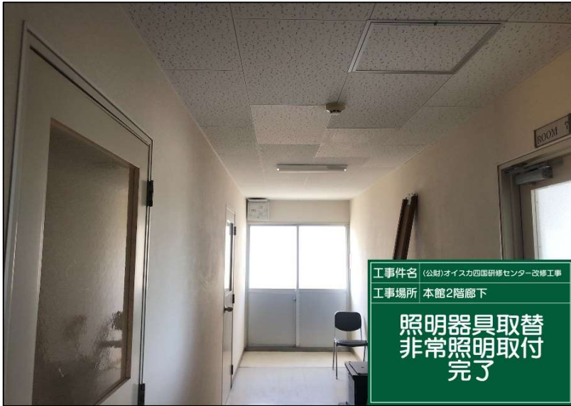
No.: 61 工種: 電気設備工事 測点: 本館2階廊下