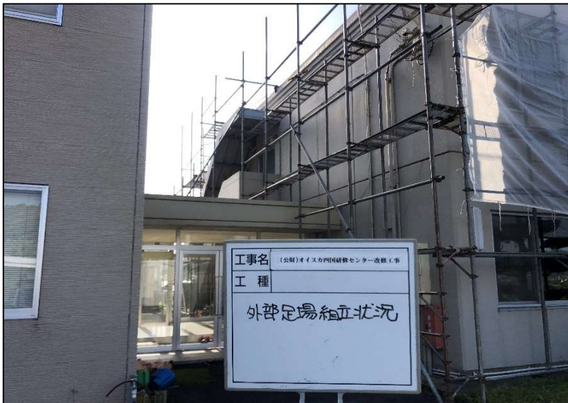
No.: 5 工種: 仮設工事 測点: 外部足場組立状況