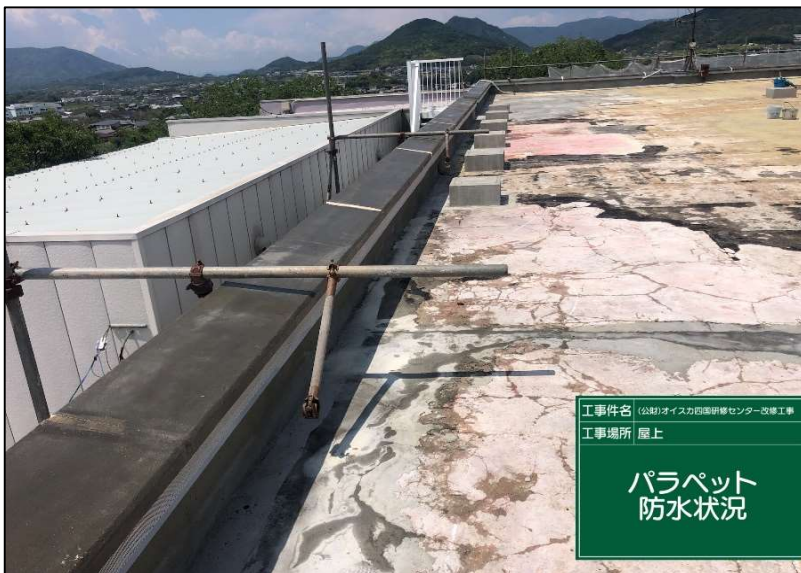
No.: 11 工種: 防水工事 測点: 本館屋上