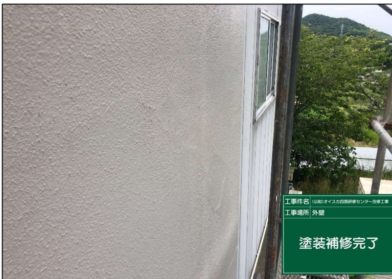
No.: 30 工種: 外壁改修工事 測点: