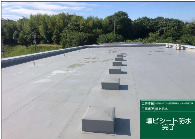
No.: 14 工種: 防水工事 測点: 本館屋上