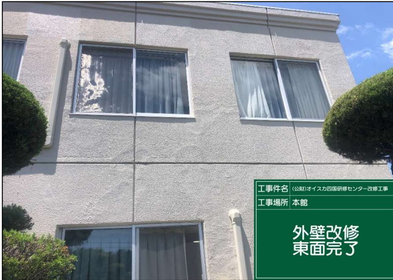
No.: 25 工種: 外壁改修工事 測点: