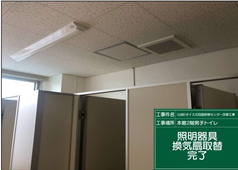
No.: 64 工種: 電気設備工事 測点: 本館2階男子トイレ