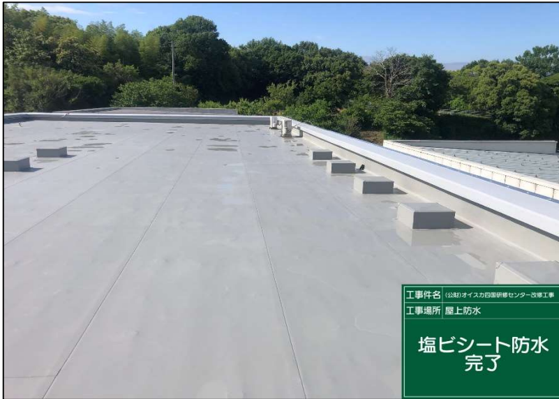
No.: 16 工種: 防水工事 測点: 本館屋上