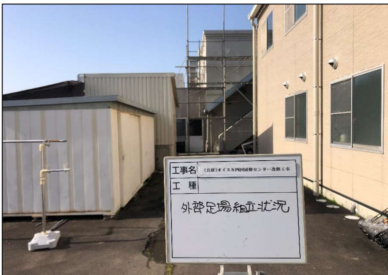
No.: 6 工種: 仮設工事 測点: 外部足場組立状況