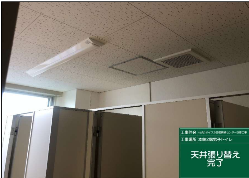
No.: 38 工種: 測点: 本館2階男子トイレ

工事件名 (公財)オイスカ国際研修センター改修工事 工事場所 本館2階 床美装・WAX 完了