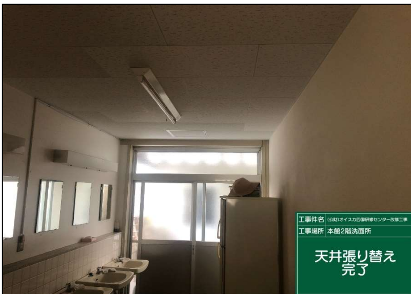
No.: 39 工種: 測点: 本館2階洗面所

工事件名 (公財)オイスカ国際研修センター改修工事 工事場所 本館2階男子トイレ 天井張り替え 完了