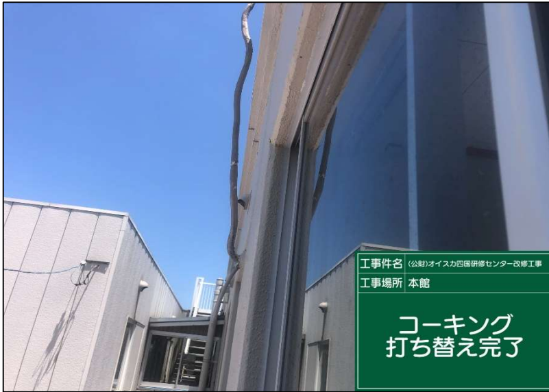
No.: 22 工種: 防水工事 測点: