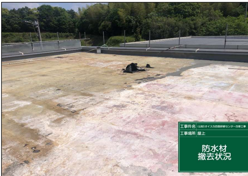
No.: 8 工種: 防水工事 測点: 本館屋上