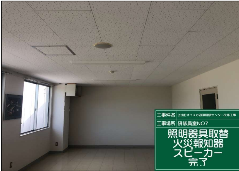
No.: 58 工種: 電気設備工事 測点: 本館2階