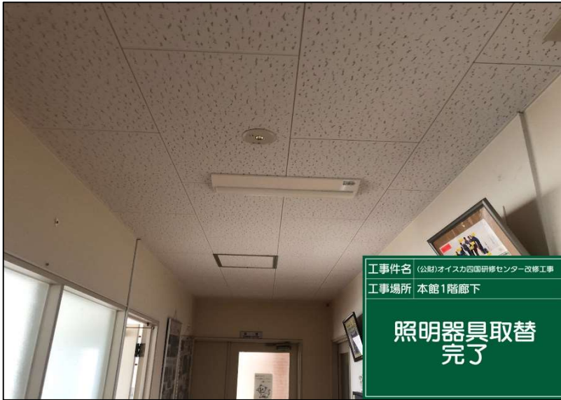
No.: 46 工種: 電気設備工事 測点: 1階廊下