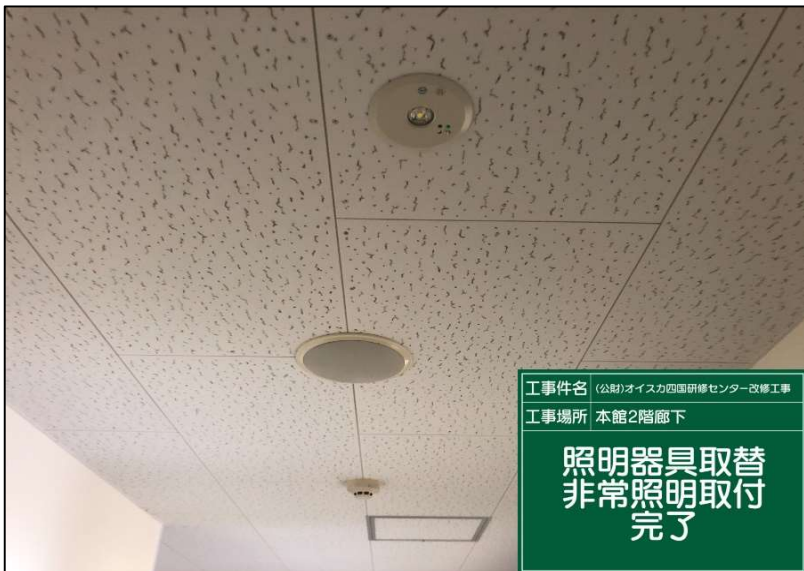
No.: 63 工種: 電気設備工事 測点: 本館2階廊下