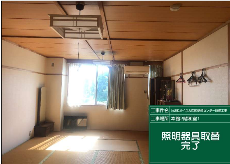
No.: 55 工種: 電気設備工事 測点: 本館2階和室