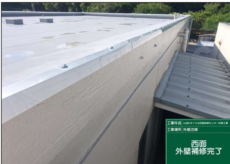
No.: 33 工種: 外壁改修工事 測点: