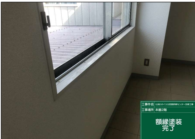
No.: 36 _____ 工種: 測点: 研修員室NO7