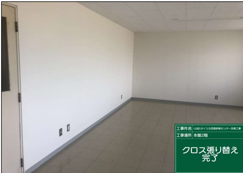
No.: 35 _____ 工種: 測点: 研修員室NO7