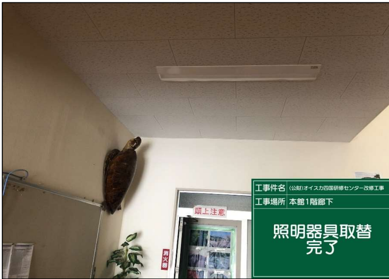
No.: 44 工種: 電気設備工事 測点: 1階廊下