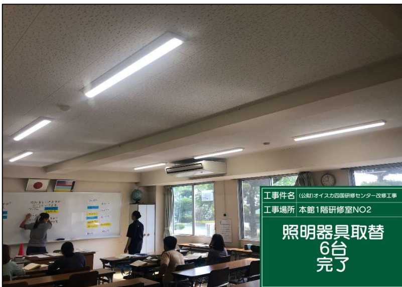
No.: 48 工種: 電気設備工事 測点: 1階研修室