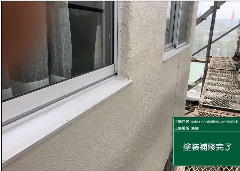
No.: 28 工種: 外壁改修工事 測点: