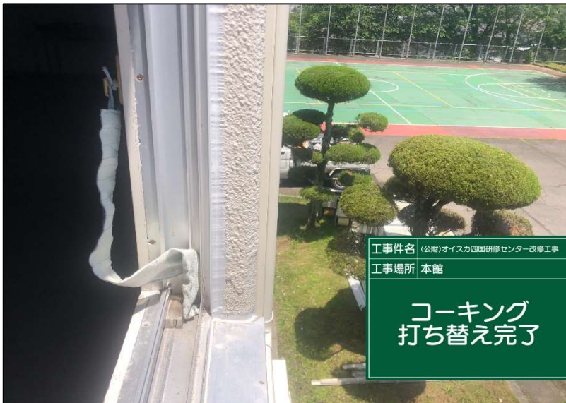
No.: 23 工種: 防水工事 測点: