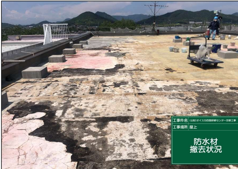
No.: 7 工種: 防水工事 測点: 本館屋上