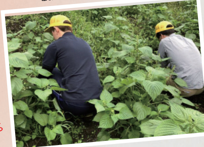
新規就農者がいなければ 移住者を呼ぶために まずは自分達が川内村で農業をすることで 就農者の気持ちになる 農業をもっと身近にプロジェクト