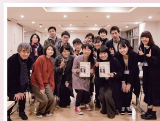
音声ガイド付き映画に興味関心を 持ってもらうことでバリアフリー映画の 普及率向上への貢献を目指す 明治大学バリアフリー映画祭実行委員会 「しろくまプロジェクト」