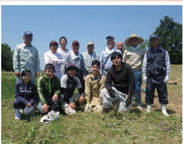
集落内の庭と関係性も私たちが お手入れします! 繋がりを編み直す エディブルガーデン化計画 いろいろあわじ