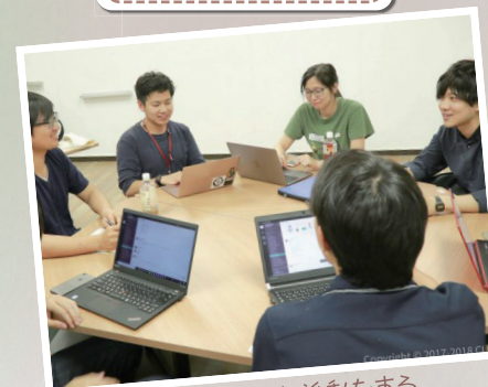
SDGsに沿った活動をする 最先端をゆく実践者・研究者による 地方の若者のためのオンラインサロン展開 CUBEプロジェクト