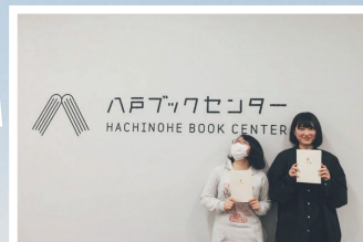
現代の生きる力である 「発信力」を体得する学び舎を 地方の高校生に提供! ことばのみちかけ