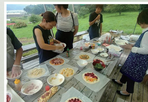
持続可能な開発のための復興支援 東海大学チャレンジセンター 3.11生活復興支援プロジェクト