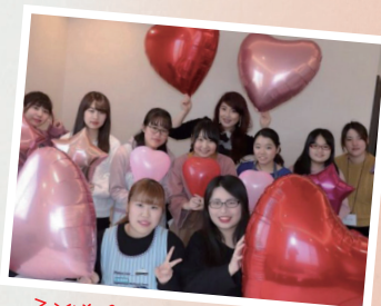
子ども食堂と認知症カフェの 概念を取り入れた 多世代参加型の居場所づくり わか