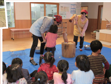
地域住民を巻き込んだ、 子どもが主役のボランティア活動 児童文化研究会 CCC