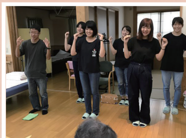
学生と社会が求めるボランティアから 誰かが行うボランティアへ 東海大学健康科学部社会福祉学科 ボランティアセンター Blossom