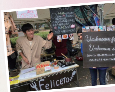
難民を知ること そして知ったことを伝えていくこと、 知った人々が難民の人々と 直接関わりを持つこと 難民支援団体Felice