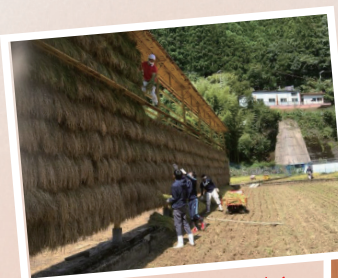
移住促進に結びつく 神納川の魅力発信をする とつづる。