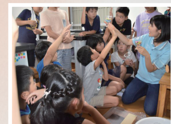
「たまには科学を団んでみよう」 日常的に人が集まり、気軽な雰囲気 科学を題材に語り合う空間作り Exedra