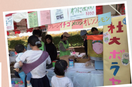
(1) 学生がボランティアを始める 一歩としての活動の提供 (2) 大学と地域の懸け橋としての役割を担う 日本社会事業大学ボランティアセンター 学生スタッフ1step