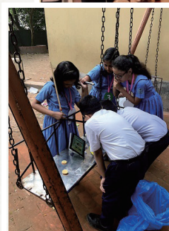
バンラデシュの 子供たちを笑顔にする ものづくり映像授業の実践 大阪大学 バングラ班