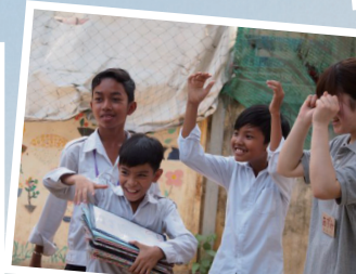
カンボジアの子ども達に 新しい経験と笑顔を届けよう! 岩手県立大学・盛岡大学 国際協力サークル smile