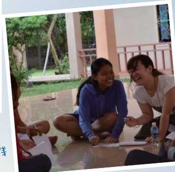
女子のみの団体という強みの下 カンボジアの孤児院の女の子に 衛生・女子保健教育を広める 学生団体レアスマイル