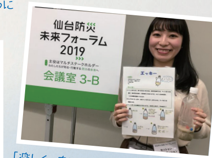
「楽しく、身になる」をテーマに 小学生対象に防災イベントを行い 笑顔を守る活動を行います Save the Smile