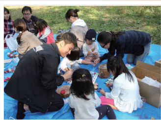
自然とfan×funによる楽しさで 子供と相模原の背中を押す 国際ボランティア団体Fan×Fun