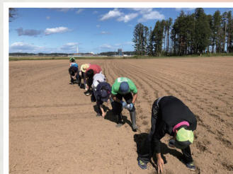
今ある物から新たな魅力を作成し 情報発信することで南相馬のイトコを 知ってもらい足を運ぶ機会を作る うんとイトコ南相馬! season2