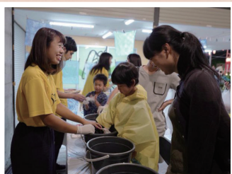
学生が「かけはし」となり 多文化・多世代が共生する 笑顔あふれる団地をつくる 芝園かけはしプロジェクト