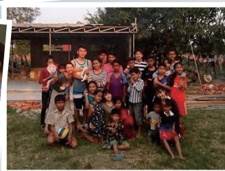
開館を迎えるカンボジアの 図書館をより活性化させたい IUYL(Inter University Youth League)