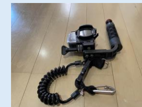
水中カメラおよびハウジング