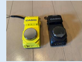
骨伝導マイク& スピーカー