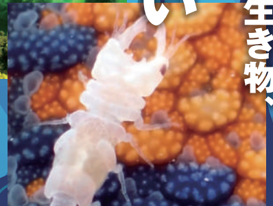
イトマキヒトデに乗ったウミクワガタ