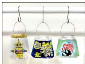
アルミ缶で プランターを作ろう！