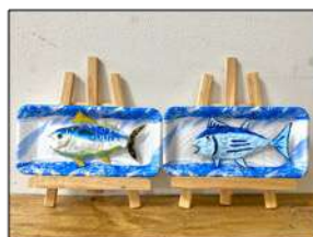
MSC認証を学んで 紙粘土でお魚を作ろう！