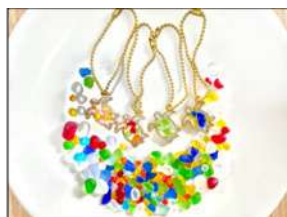
シーグラスで カメのチャームを作ろう！