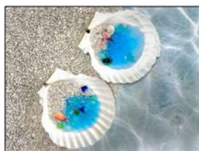
ホタテの貝殻で 海の世界を作ろう！