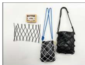
地球にやさしい漁網で マイバッグを作ろう！