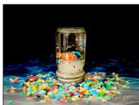
マイクロプラスチックで アクアドームを作ろう！