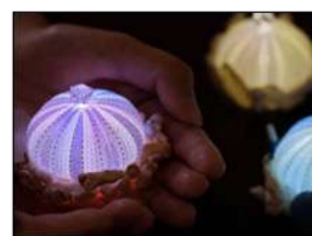
ウニの貝殻で ランプを作ろう！