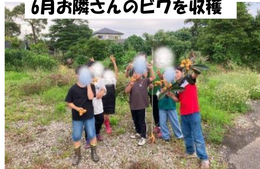
6月お隣さんのビワを収穫