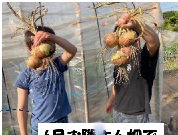
6月お隣さん畑で、 玉ねぎ収穫