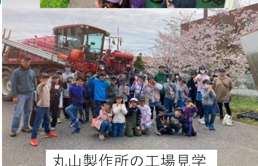
丸山製作所の工場見学