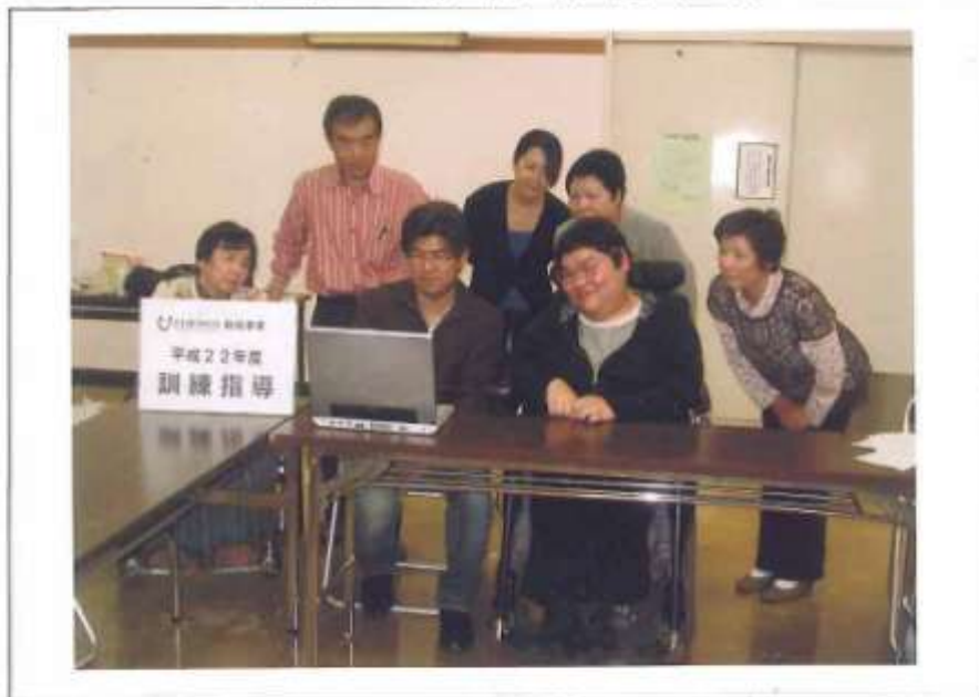
事業の実施状況写真