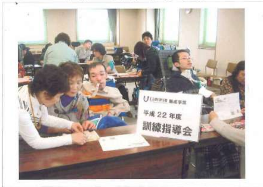
事業の実施状況写真