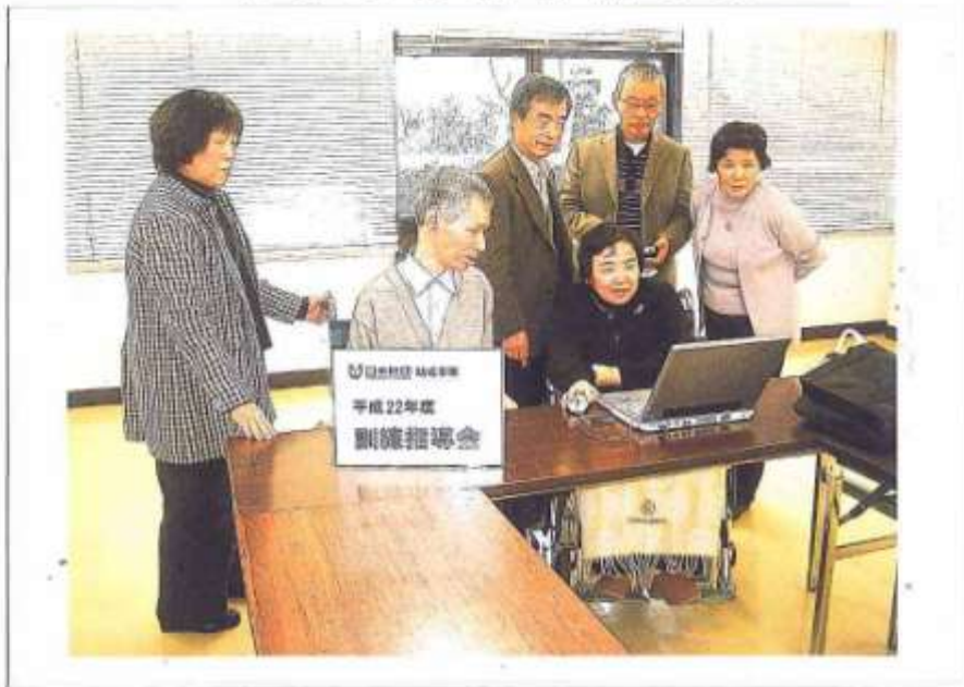
事業の実施状況写真