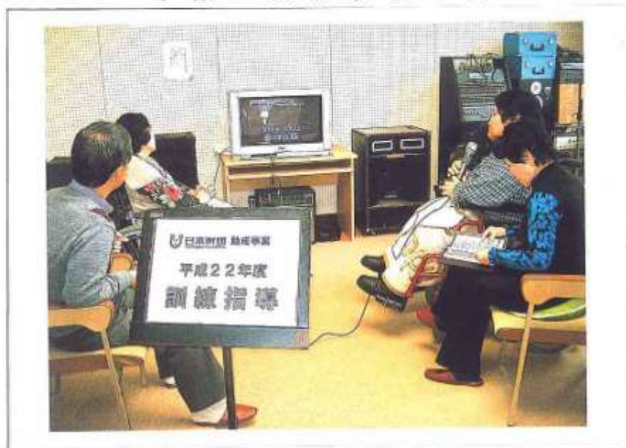
事業の実施状況写真