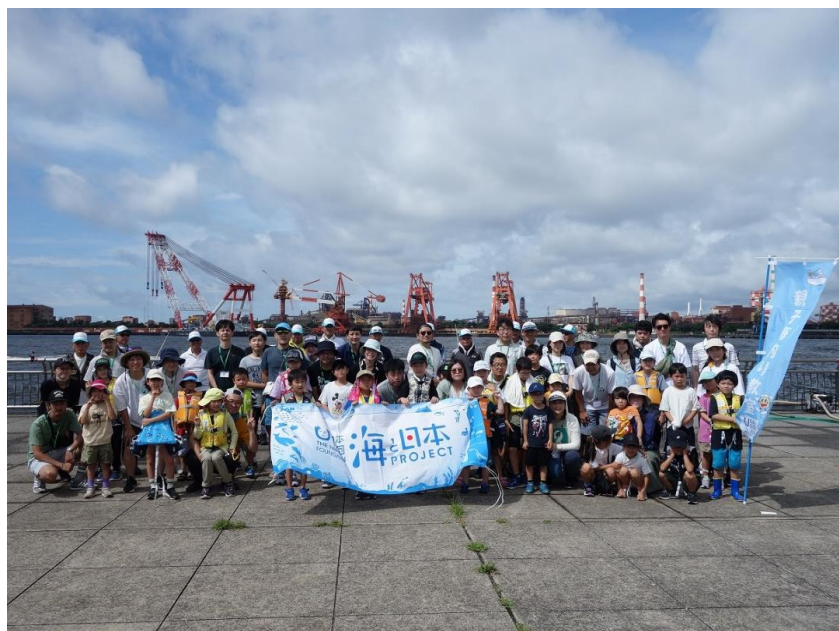
川崎市市制100周年記念 第51回川崎みなと祭り