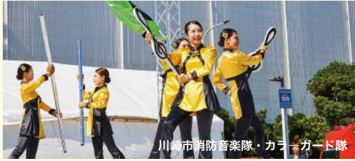
川崎市消防音楽隊・カラーガード隊