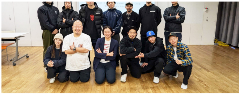
【研修を受けた皆さんと記念撮影】

研修後感想アンケートでは「まずは所属している子供たちや保護者たちとのコミュニケーション、お互いの認識のすり合わせから始めてみようと思った」「女性アスリートへの上手な声掛け等、気をつけていこうと思った」とコメントを頂きました。