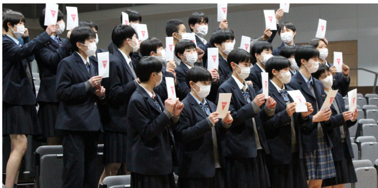
【クイズの様子。なかには難しい問題も...?】

授業終了後のアンケートでは、「これからバレーボールを続けるためにも自分の身体を大切にしたいと思った」、「まずは月経周期や自分のコンディションについてしっかり知ろうと思った」、「新しいチームに所属しても自分のことを理解してもらおう行動を選べるようにしたい」など、とても前向きなコメントをいただきました。