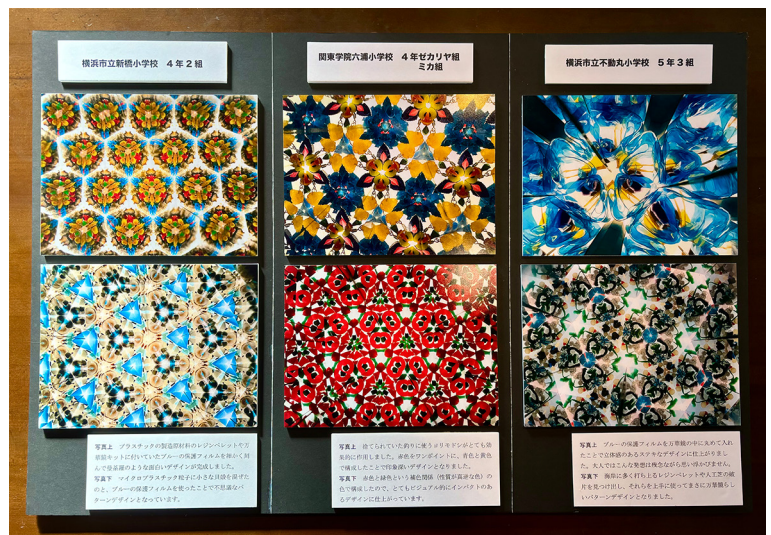
横浜市立新橋小学校、関東学院六浦小学校、横浜市立不動丸小学校の子どもたちの作品。